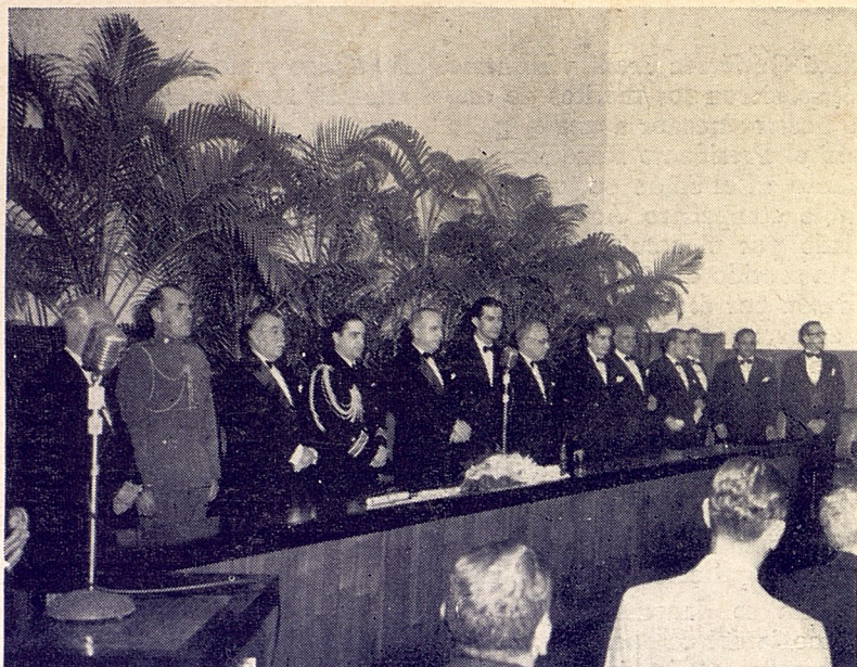
Presidencia del acto de la Inauguración del Edificio del Colegio Provincial de la Habana