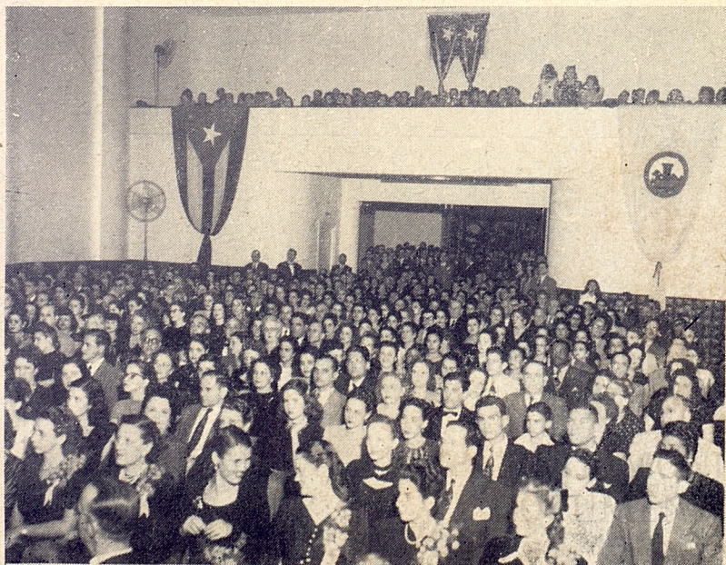
Parte de la distinguida y numerosa concurrencia que asistió a la inauguración del edificio y toma de posesión de los nuevos ejecutivos.