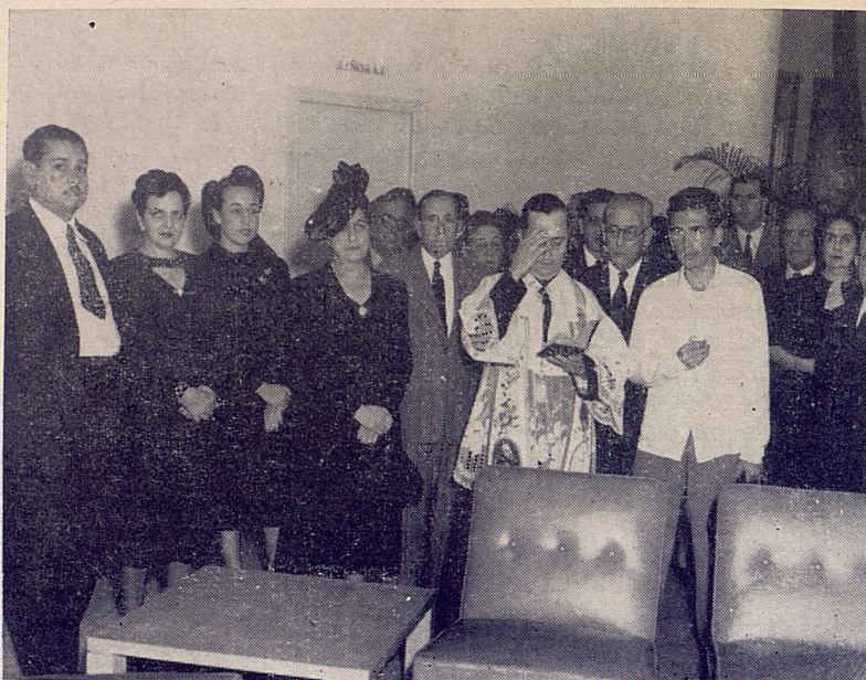
Acto de la bendición de nuestro edificio social por el Reverendo Padre Llaguno.

distintas asignaturas, especialmente las de dibujo de los primeros años, se imparta de acuerdo con las nuevas normas que se están implantando como vía de ensayo en las Universidades más avanzadas de América y Europa, teniendo en cuenta que todas esas enseñanzas deben estar íntimamente ligadas, con un solo punto de mira como meta: el de formar arquitectos competentes en la época actual.