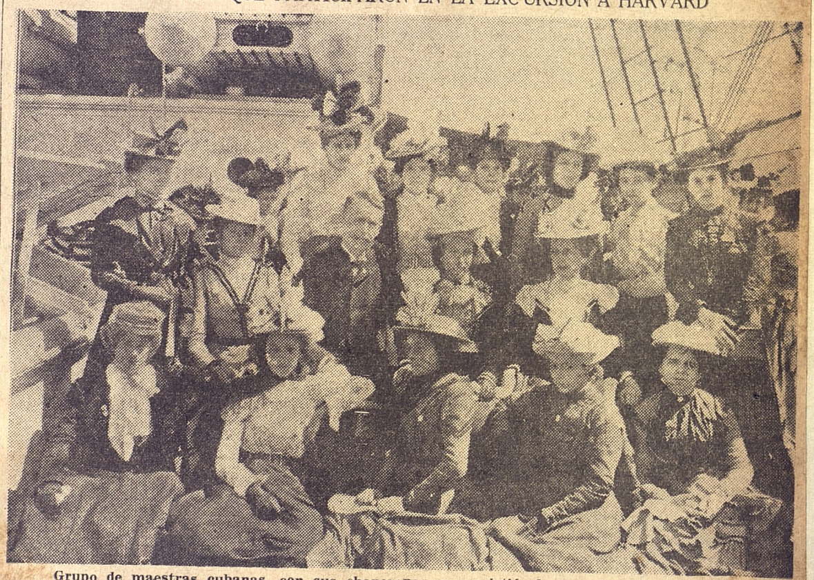
Grupo de maestras cubanas, con sus chaperonas, que asistió al curso de Harvard, en 1900.