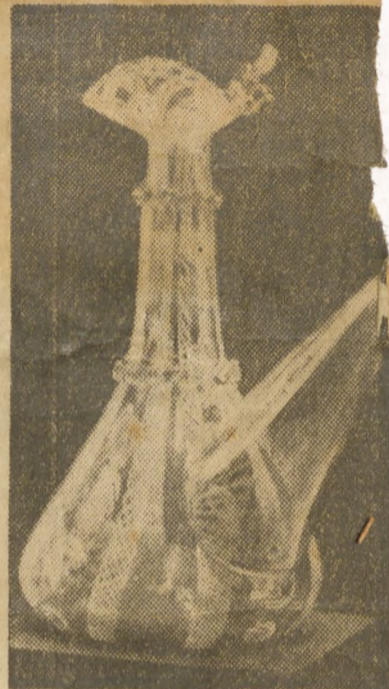
Porrón del siglo XVIII. Vidrio azul claro soplado con franjas y óvalos lactinios. El modelo de hace dos siglos para el vino, se encuentra aun ahora vigente entre los campesinos españoles.

Aparte de los antecedentes autóctonos, se da por cierta una gran influencia de los vidrios venecianos —desde las primeras décadas del siglo XVI— con los cuales llegaron a rivalizar. Tradiciones distintas y elementos de