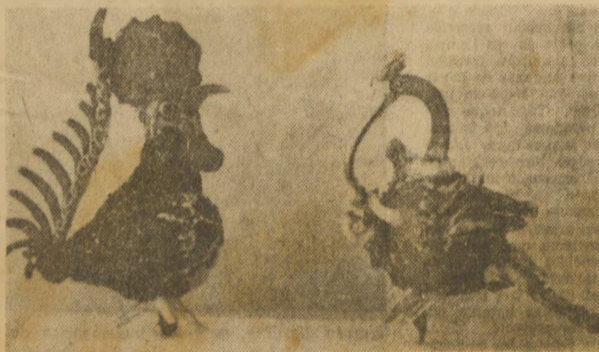
Para adornar las carnes en la mesa se usaban estos husos en hilos de vidrio policromo (siglo XVIII).

Aún teniendo en cuenta su carácter decorativo, la sencillez de sus formas y lo generalizado de su uso, es posible su inclusión en la categoría de lo popular, esa fuente siempre de información y de disfrute.