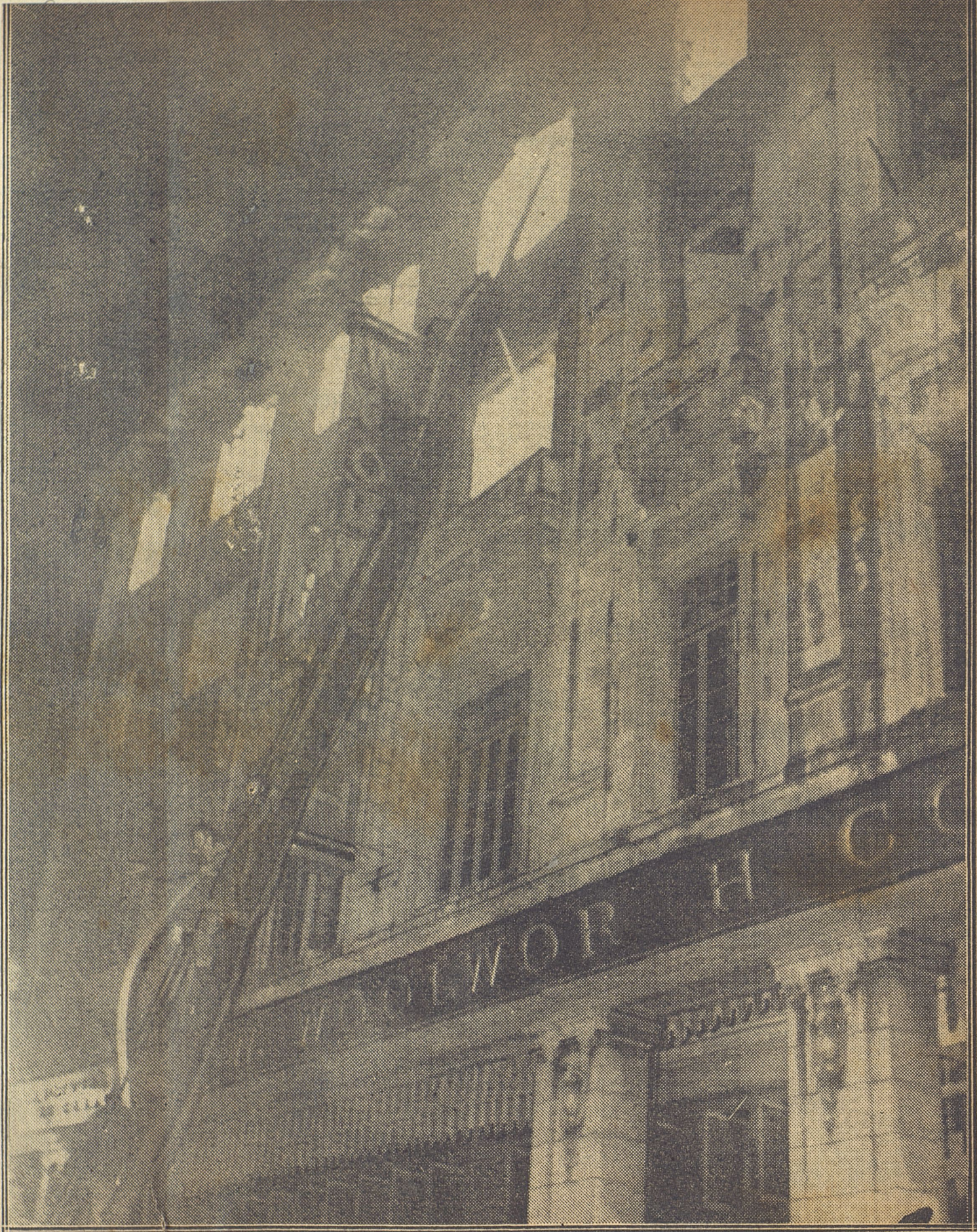
EXTINCIÓN.—Estas fotos ofrecen una impresión de la magnitud del siniestro. Arriba, izquierda, las llamas brotando de las ventanas; al lado, soldados combatiendo el fuego con el extinguidor del Cuerpo de Aviación; debajo, un viejo bombero que acudió a prestar servicio y una vista del Ten Cents por Galiano. (Fotos Collado Jr.).