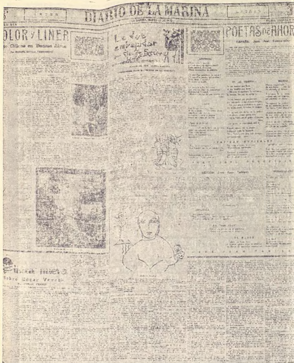
Primera página del Suplemento literario correspondiente al día 13 de marzo de 1927, fecha en que se inicia su renovación. Aparecen las nuevas secciones fijas: "Color y línea", "Poetas de ahora", "Música nueva".