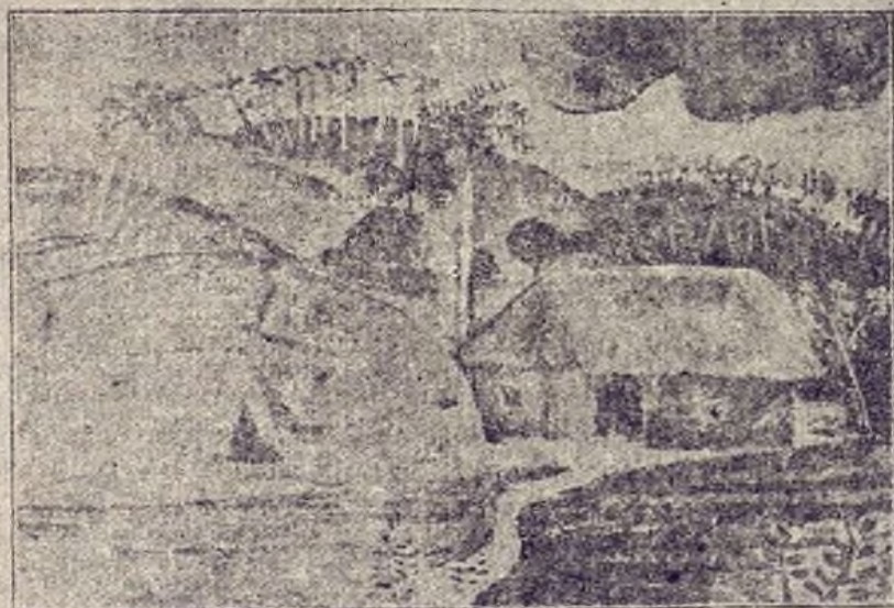
Las Palmas Genuinas (óleo) propiedad de Alejo Carpentier.

Emparentado con los tiernísimos desnudos de Modigliani—¿qué pin-