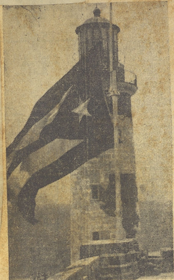
La farola del Morro, atalaya de nuestras actividades marítimas, que es símbolo universal de la ciudad.

ciéndose de inmediato en la rectoría de esa actividad los perjuicios derivados de cualquier exceso por el alto costo de operación en la descarga o embarque de mercancías como consecuencia de la desorganización laboral.