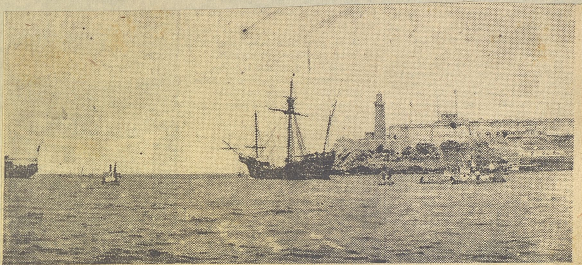
Las carabelas enviadas a la Exposición de San Luis, en 1892, a su paso por La Habana