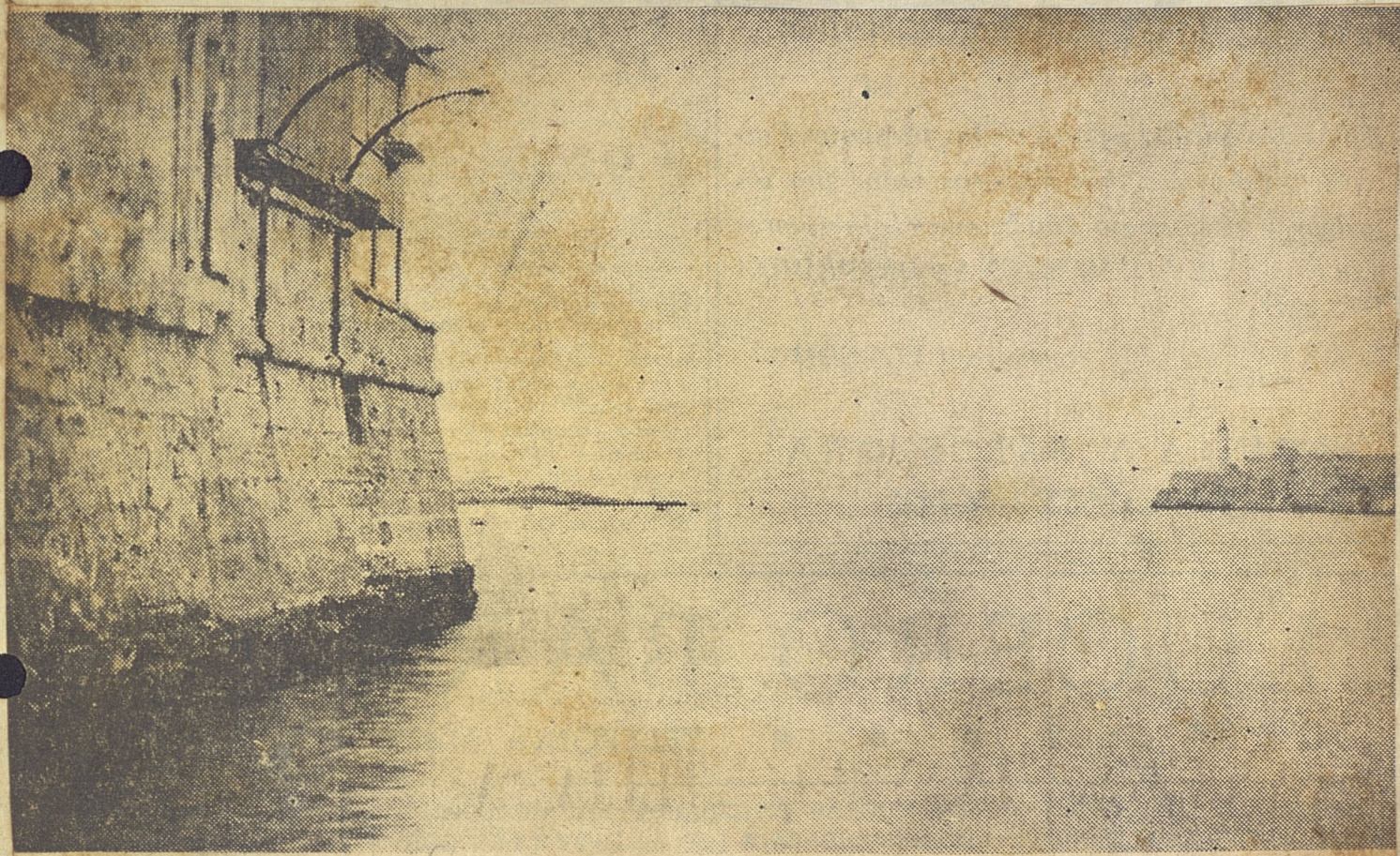
El canal del Puerto, visto desde el pequeño muelle de la Maestranza de Artillería, (antigua Cortina de Valdés).