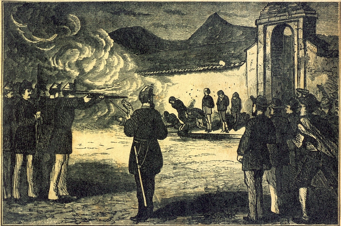
Ejecución del capitán Fry y sus camaradas.

UNIVERSIDAD NACIONAL DE HISTORIA HOMENAJE A JOSE MARTI EN EL CENTENARIO DE SU NACIMIENTO SECRETARIA DE CULTURA Y TURISMO DE CUBA NOVIEMBRE 19, 20, 21 Y 22 DE 1928