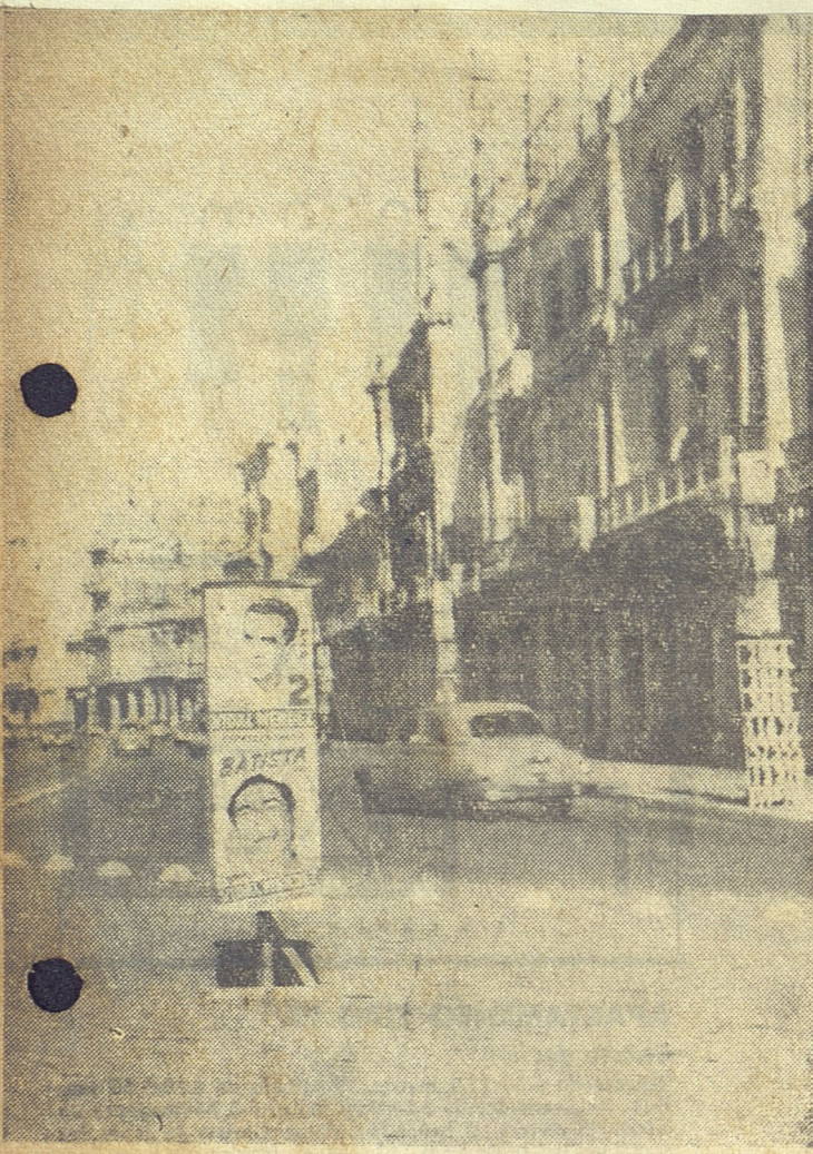
He aquí otra demostración de cómo las propagandas políticas no respetan ningún rincón de la ciudad, por muy importante que sea. Aquí tenemos las efigies de los candidatos adornando el paseo del Malecón, como una profanación contra nuestro progreso urbanístico.