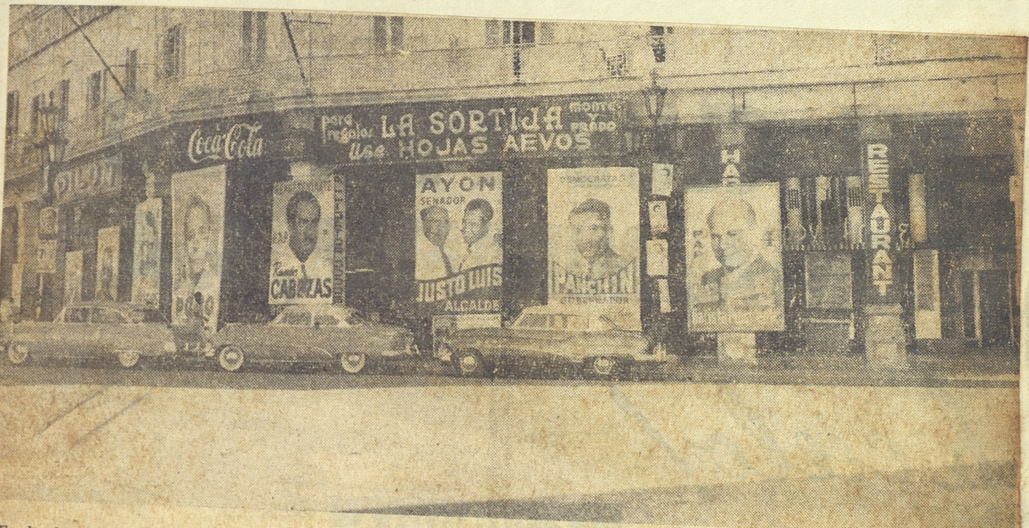
En la Acera del Louvre, frente al Parque Central de La Habana, grandes pasquines exhiben los sonrientes rostros de los candidatos, dando a ese lugar el aspecto de una feria de aldea.