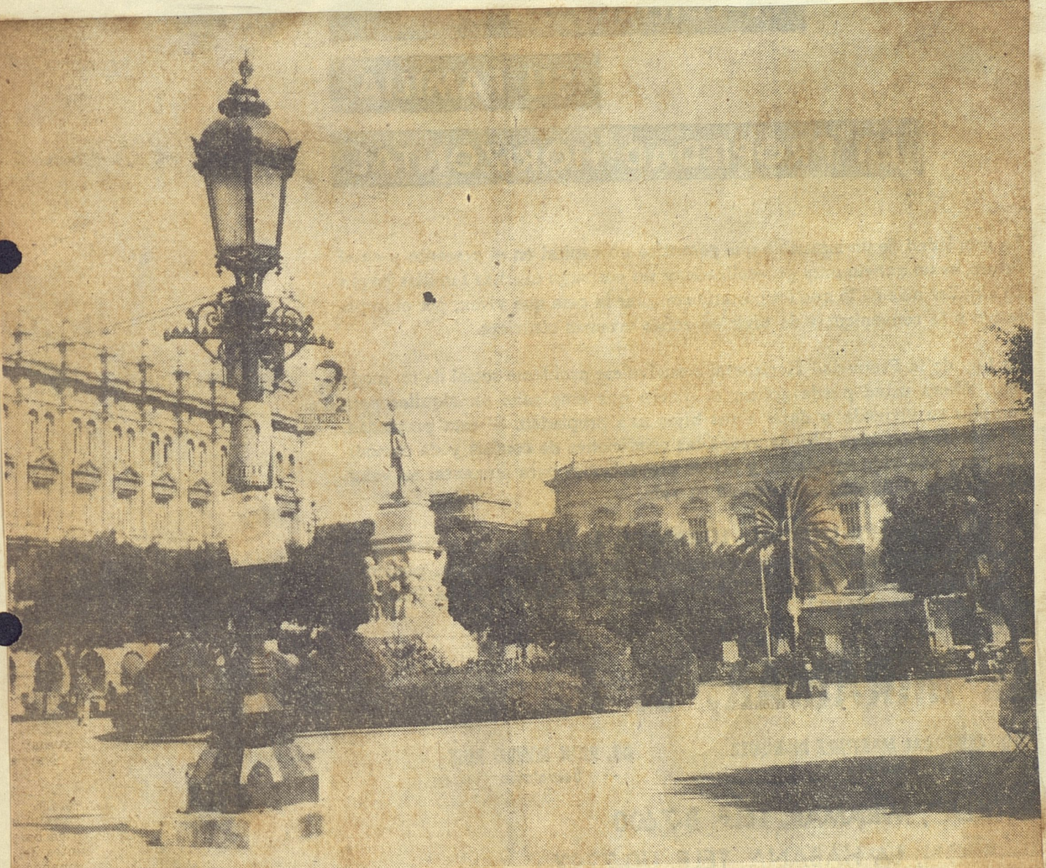
La plaga de los pasquines no ha respetado ni los lugares más serios y solemnes de la Capital. Aquí, en pleno Parque Central y cerca de la estatua de José Martí, se ven los pintorescos cartelones de los candidatos colgando de las farolas.