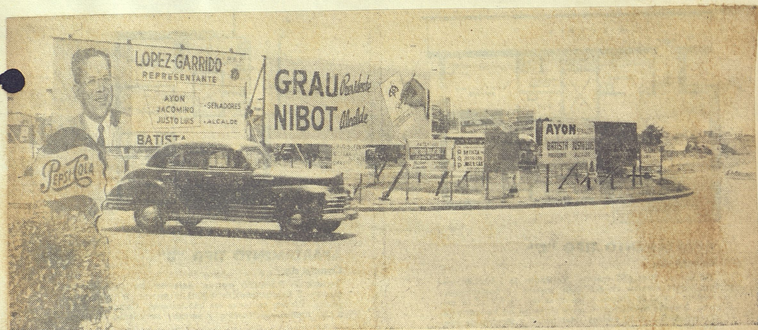
y cerca de la Plaza de la República y del monumento vertical a José Martí, los pasquines montan guardias como si quisieran demostrar que son capaces de introducirse en todos los lugares, sea un suburbio o el centro mismo de la ciudad.