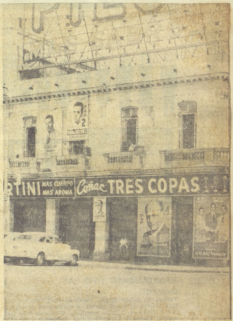
En Belascoain y San Lázaro los pasquines emergen con la mayor naturalidad y algunos se han encaramado encima de los balcones para observar mejor el panorama. Son una expresión elocuente de nuestras burdas propagandas políticas.