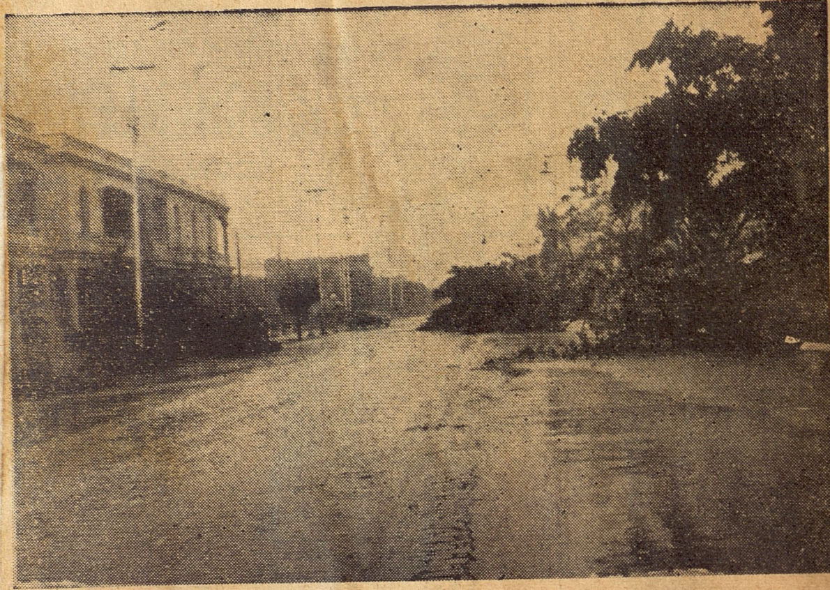
La Calle 23, en el Vedado, quedó casi enteramente bloqueada por los grandes árboles que la adornaban. Esta vista puede dar una idea de la situación en que deben hallarse las carreteras de la República.