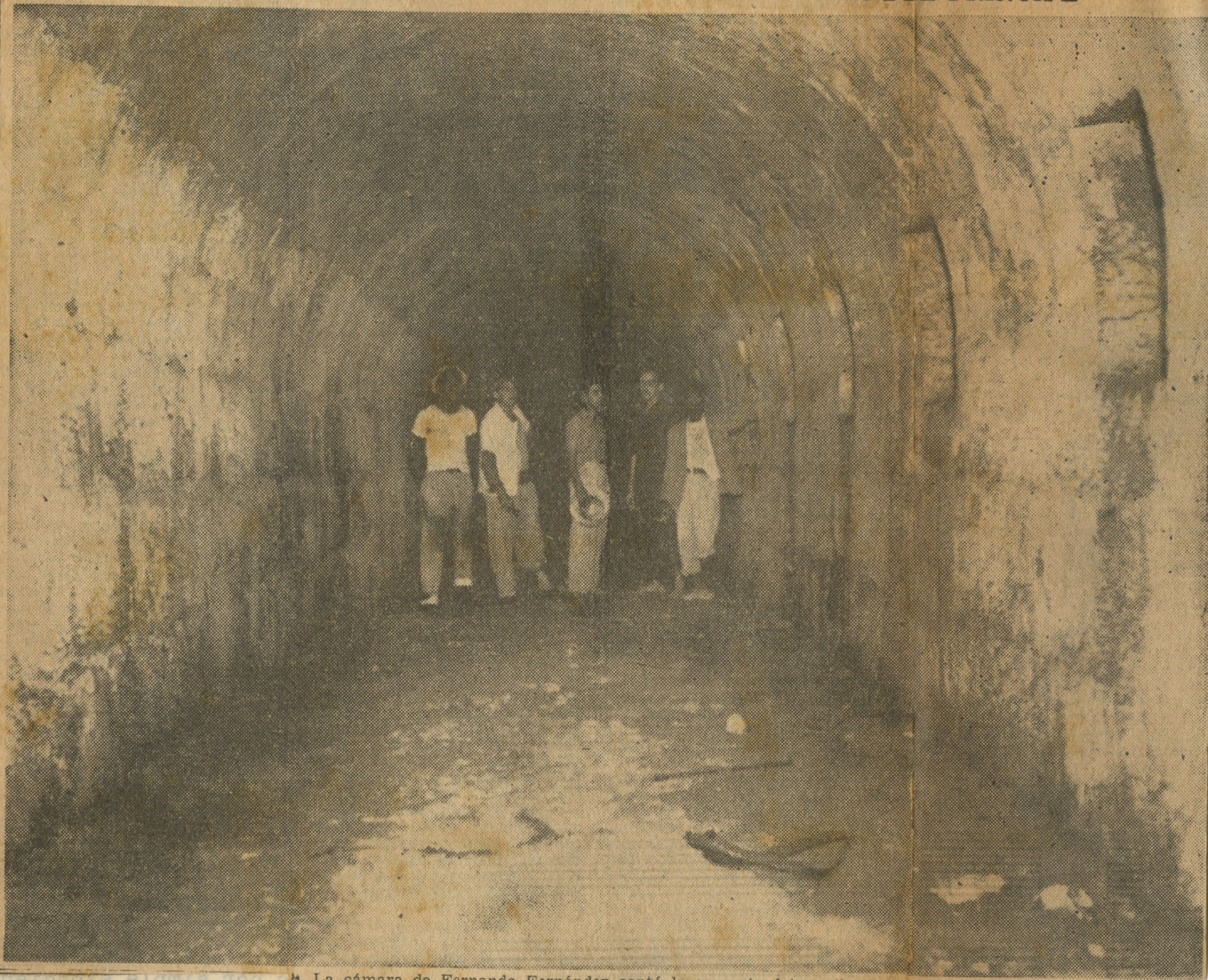
La cámara de Fernando Fernández captó la presente fotografía que reproduce una sección de la amplia galería que parece rodear la Loma del Príncipe, a la cual conduce uno de los varios subterráneos descubiertos y explorados por los obreros que hacen las excavaciones para los cimientos del que será Hospital de la Liga Contra el Cáncer de Cuba. Las aberturas que se observan a la derecha del grabado corresponden a unas aspilleras, casi totalmente obstruidas por la vegetación, que miran hacia los fosos de la antigua fortaleza que hoy es utilizada como prisión.