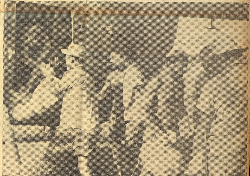
Los helicópteros han realizado una labor inapreciable. Incansables, los pilotos han evacuado a millares de compatriotas y con esa acción han salvado muchas vidas; y también ahora, ya pasado el peligro, cooperan directamente en la distribución de alimentos y ropas.