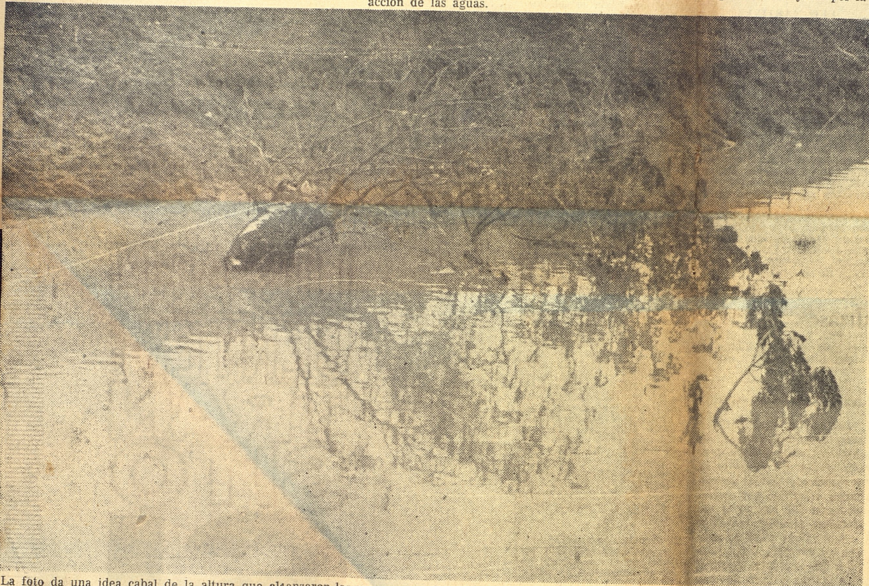
La foto da una idea cabal de la altura que alcanzaron las aguas en muchos lugares de Oriente. Lo que sobresale del improvisado mar es la copa de un árbol. Y entre sus ramas aparece una res ahogada, que fue arrastrada hasta allí por la corriente.