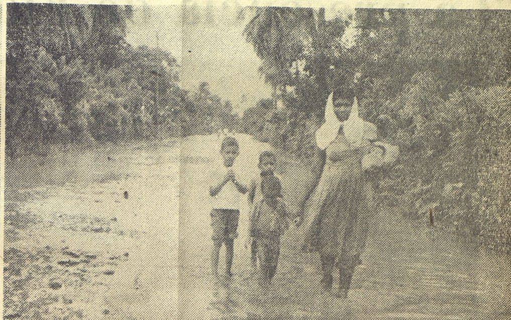
En La Julia, Bayamo, el agua ha ido bajando lentamente. El tránsito es posible pero en la forma que se aprecia en la foto: caminando entre fangales y charcos. Precisamente por este motivo se ha intensificado la vacunación de los residentes en zonas afectadas para prevenir epidemias.