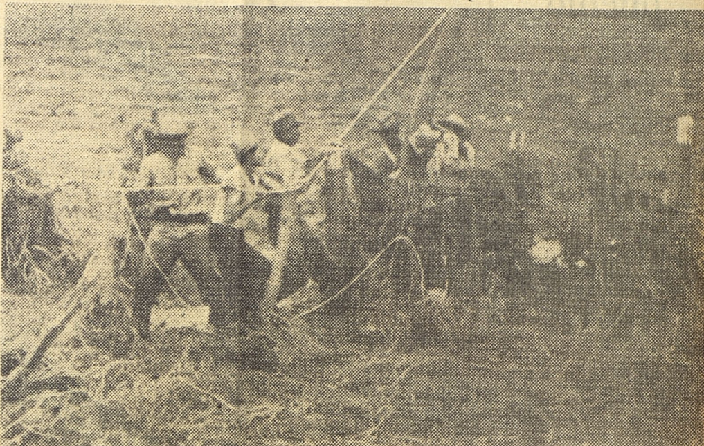
A pocas horas de haberse retirado el agua de los ríos desbordados, los campesinos y los obreros se enfrascan en las tareas de reconstrucción, haciendo bueno el mensaje dirigido al pueblo por el comandante en Jefe, Fidel Castro, en su Comunicado. El esfuerzo de todos los cubanos, en los distintos frentes, hará posible la restauración de todo lo que el ciclón destruyó a su paso.