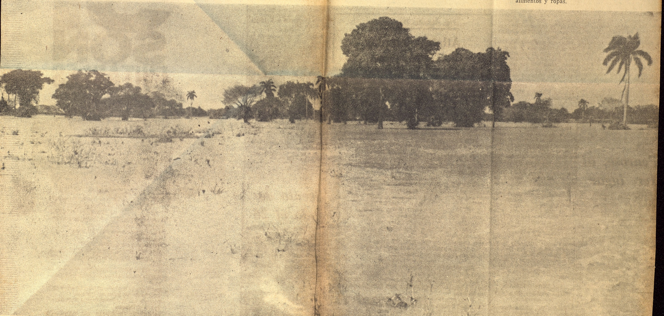
No es arena, como a simple vista parece. Es agua de los ríos desbordados que, a pesar de los días transcurridos desde el paso del ciclón "Flora", todavía mantienen una altura considerable en muchas zonas de la región oriental, siendo necesario todavía utilizar helicópteros y anfibios en labores de rescate, para poner a salvo familias campesinas.