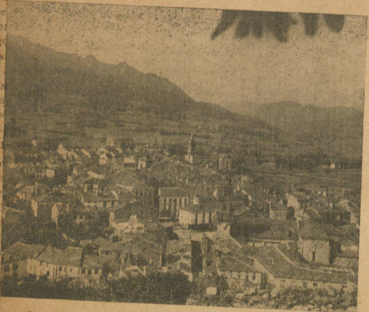
Vista parcial de la culta ciudad de Mondoñedo —provincia de Lugo—, en cuyas tierras y recinto vieron la luz tantos varones ilustres, representativos de todas las nobles artes del saber.