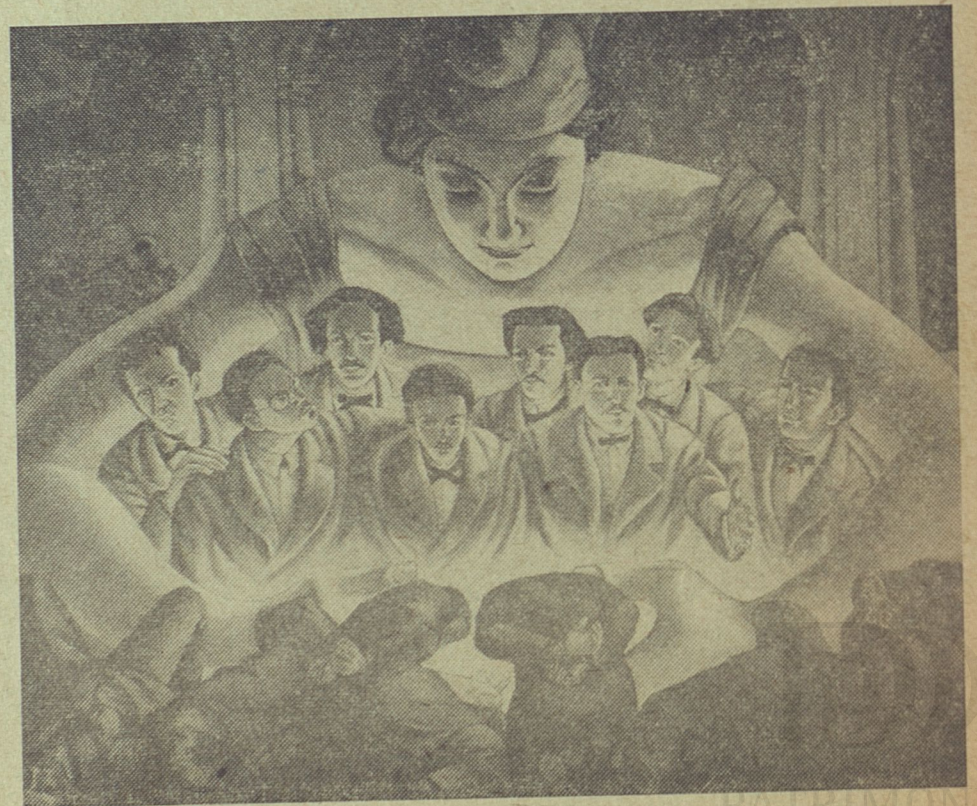
Detalle del mural ¡Inocentes! As. de Alumnos Esc. Prof. de Comercio, La Habana.

1957.—“¡Inocentes!”, Asociación de Alumnos de la anterior escuela. Acrilato, 16.82 metros 2 . Mural con las causas y personajes que originaron el fusilamiento de los estudiantes de Medicina en 1871. Al mismo tiempo, es un canto al martiroológico y una denuncia contra el odio, la intransigencia, la política de resentimiento, la discriminación y la violencia.