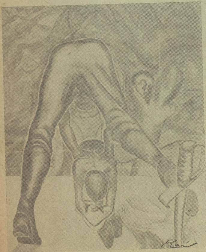
La opresión militar. Liceo de Guanabacoa.