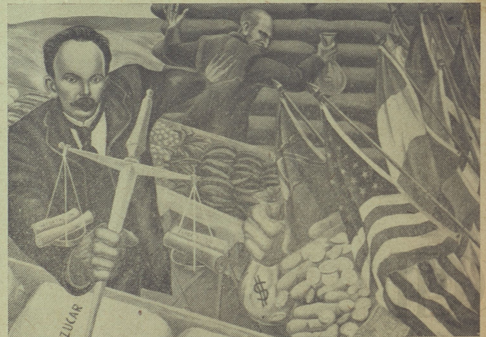
Detalle del mural "Conceptos marxistas sobre economía y comercio". Escuela Profesional de Comercio de La Habana.

Por otra parte, por qué seguir admitiendo en el campo del arte, esas transferencias de los sentimientos antisociales, a favor de la deshumanización, propia de los afeminados, tan afectos a lo exótico, absurdo y accidental? ¿Por qué un