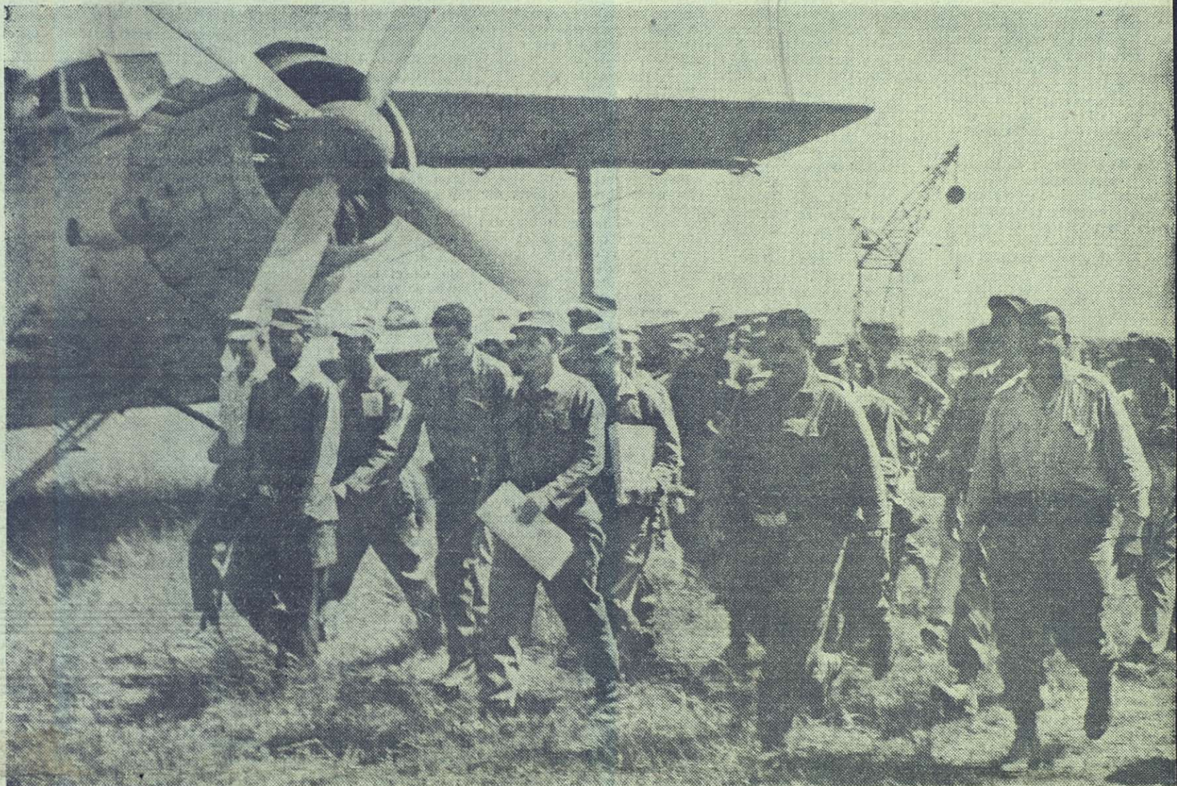
El viceprimer ministro y ministro de las Fuerzas Armadas Revolucionarias, comandante Raúl Castro, acompañado de miembros del Ejército Rebelde y del PURSC, cuando llegaba al aeropuerto de Bayamo en la provincia de Oriente, para tomar parte en las tareas de auxilio a los damnificados en las zonas afectadas por el ciclón.—(Foto: Prensa Latina).