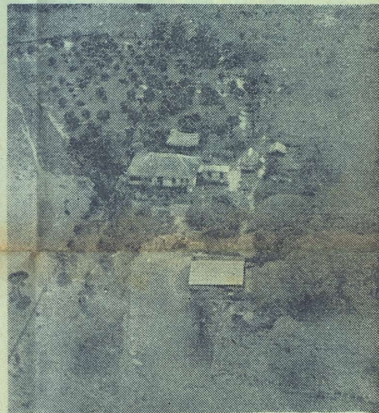
Vista aérea de una zona agraria de Oriente, donde puede apreciarse los campos de siembra cubiertos por las aguas. Todo cuanto allí había sembrado se perdió.

DIARIO DE la tarde ⑤ La Habana, 11 de Octubre de 1963