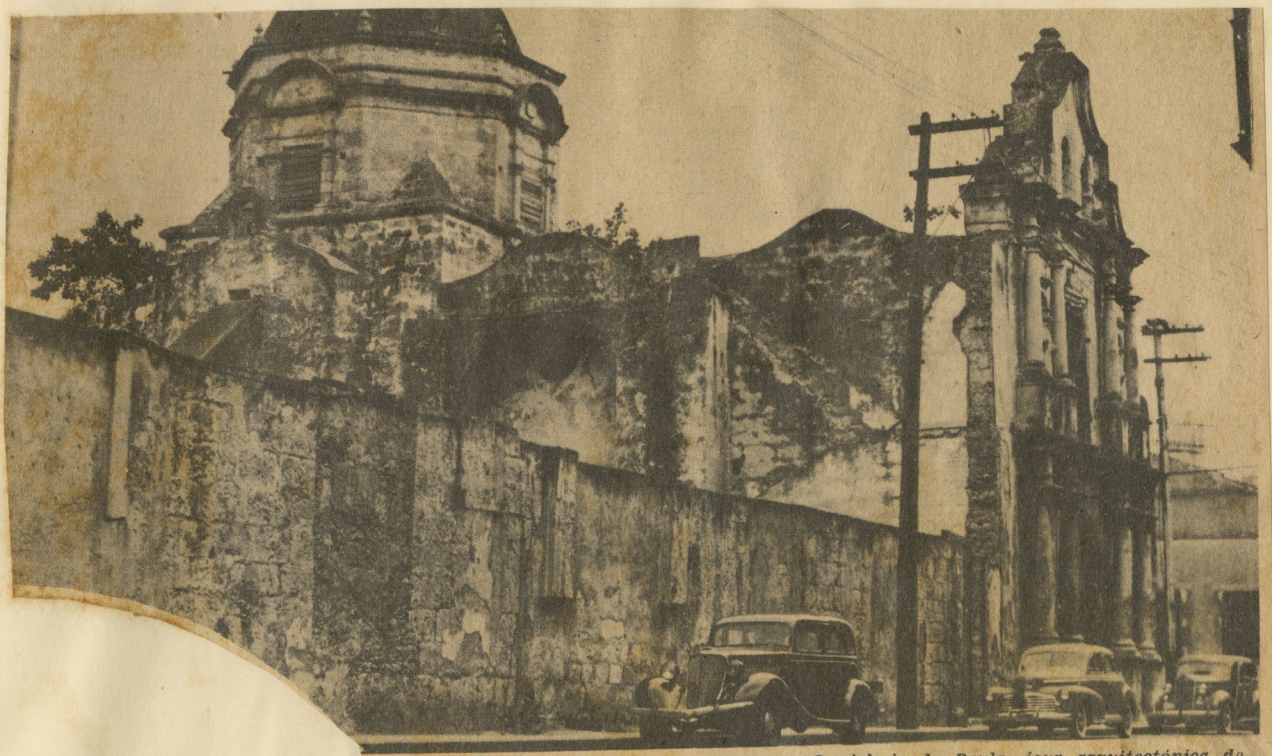
Un detalle de la cúpula.