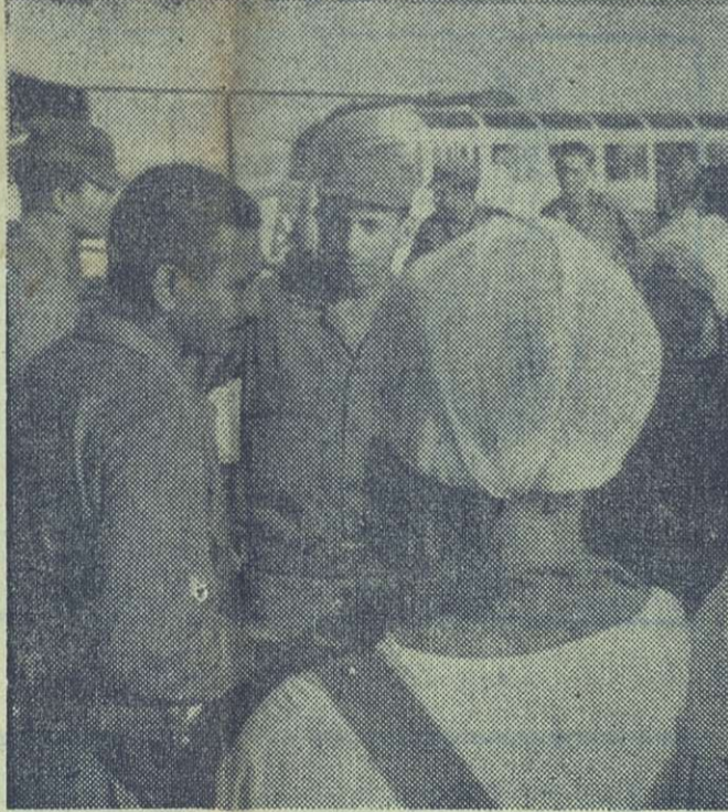
Los comandantes Juan Almeida y José Machado Ventura dictan instrucciones a las enfermeras movilizadas.