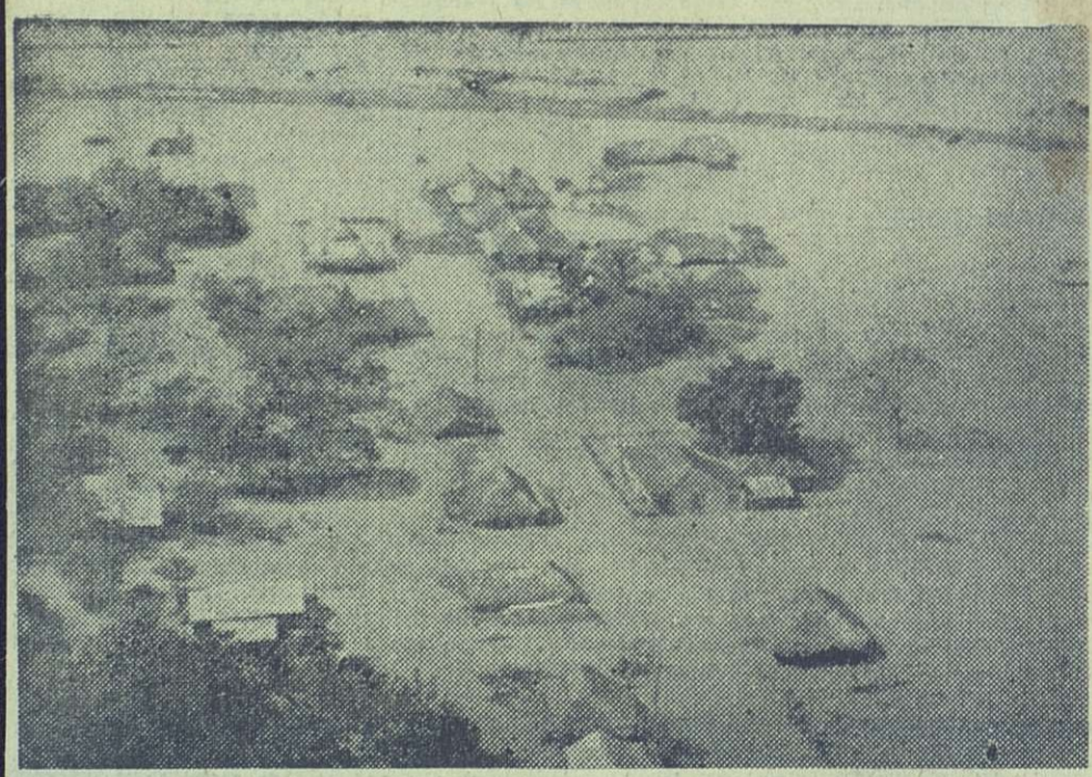
Poblados enteros quedan sumergidos por el agua en extensas zonas orientales.