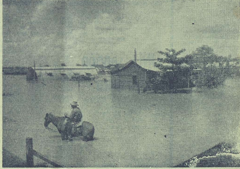
En medio de la corriente, el campesino trata de salvar a su cría de cerdos.