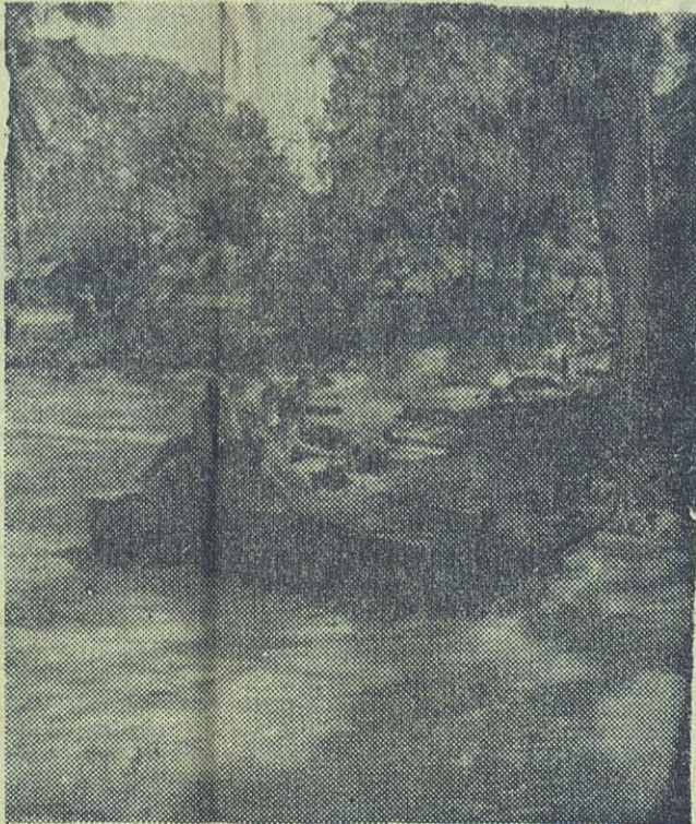
Una tanqueta avanza para continuar la operación de rescate.