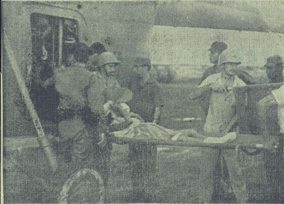
Ministro de Salud Pública, comandante Machado Ventura, labora junto a miembros del Ejército y la Cruz Roja en la atención a las víctimas.