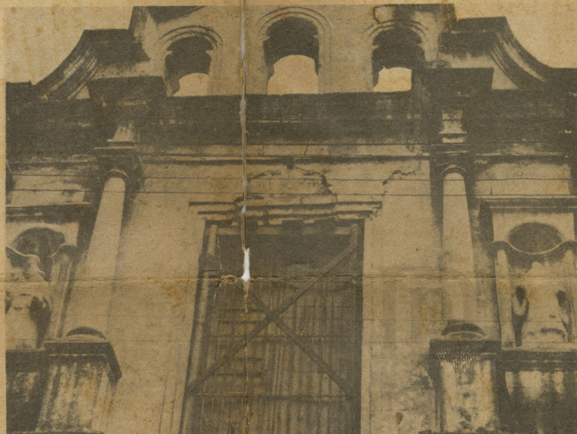
Un detalle del frente.