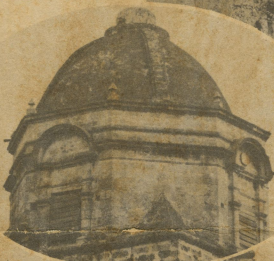
Un detalle de la cúpula.

y advirtiéndole que "no se considera obligada ni está dispuesta a reparar, ni a reedificar, ni a realizar obra alguna en el citado edificio".