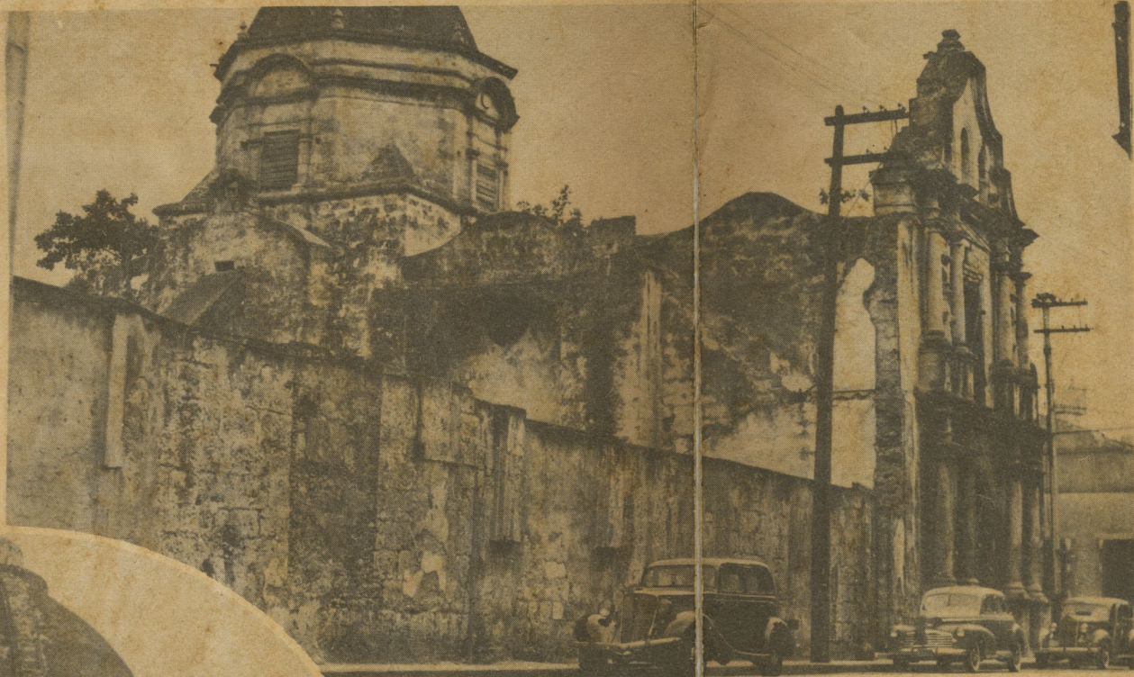
La iglesia de Paula, joya arquitectónica de La Habana antigua, que una vez más corre peligro de ser destruida.