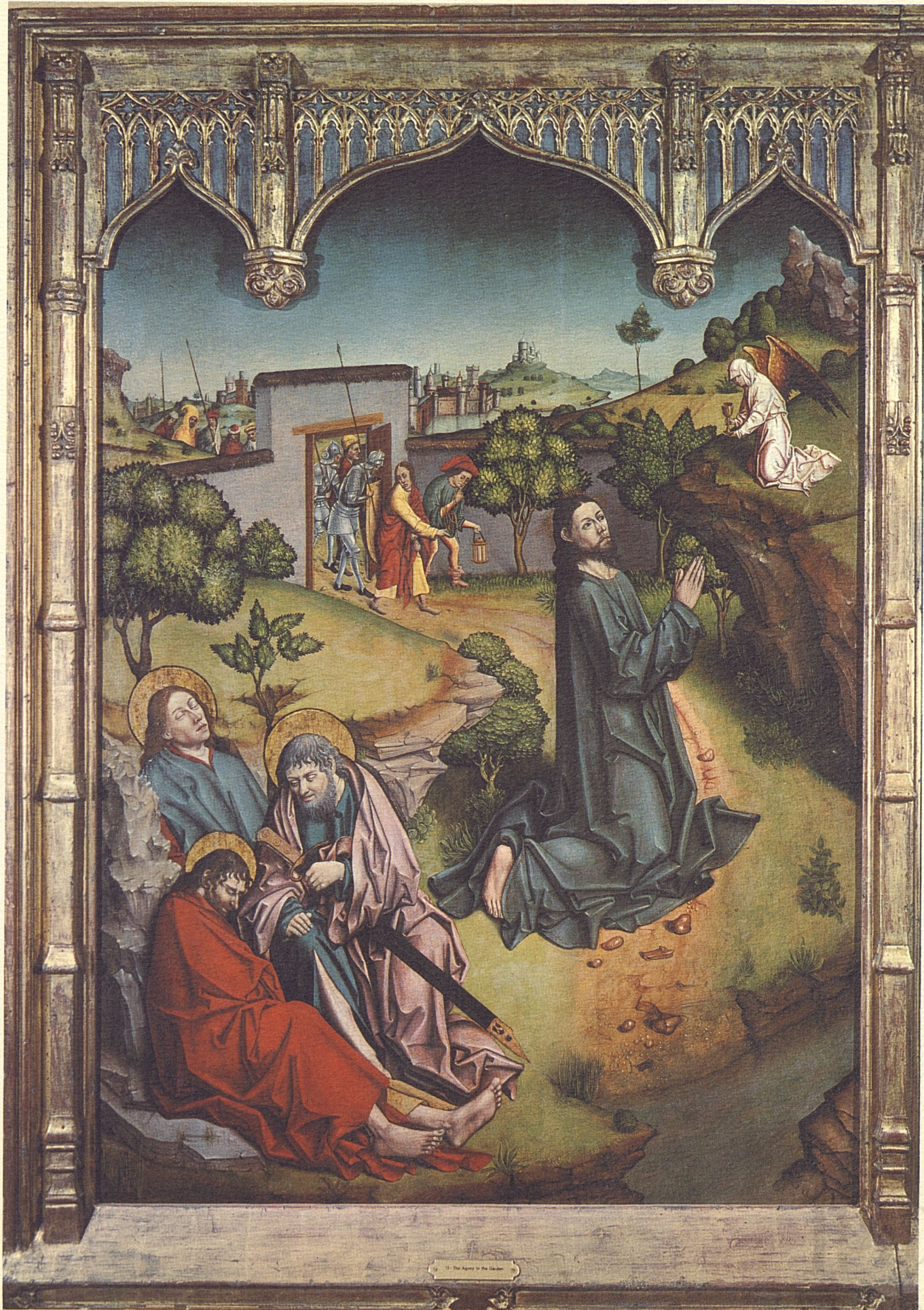
11. The Agony in the Garden