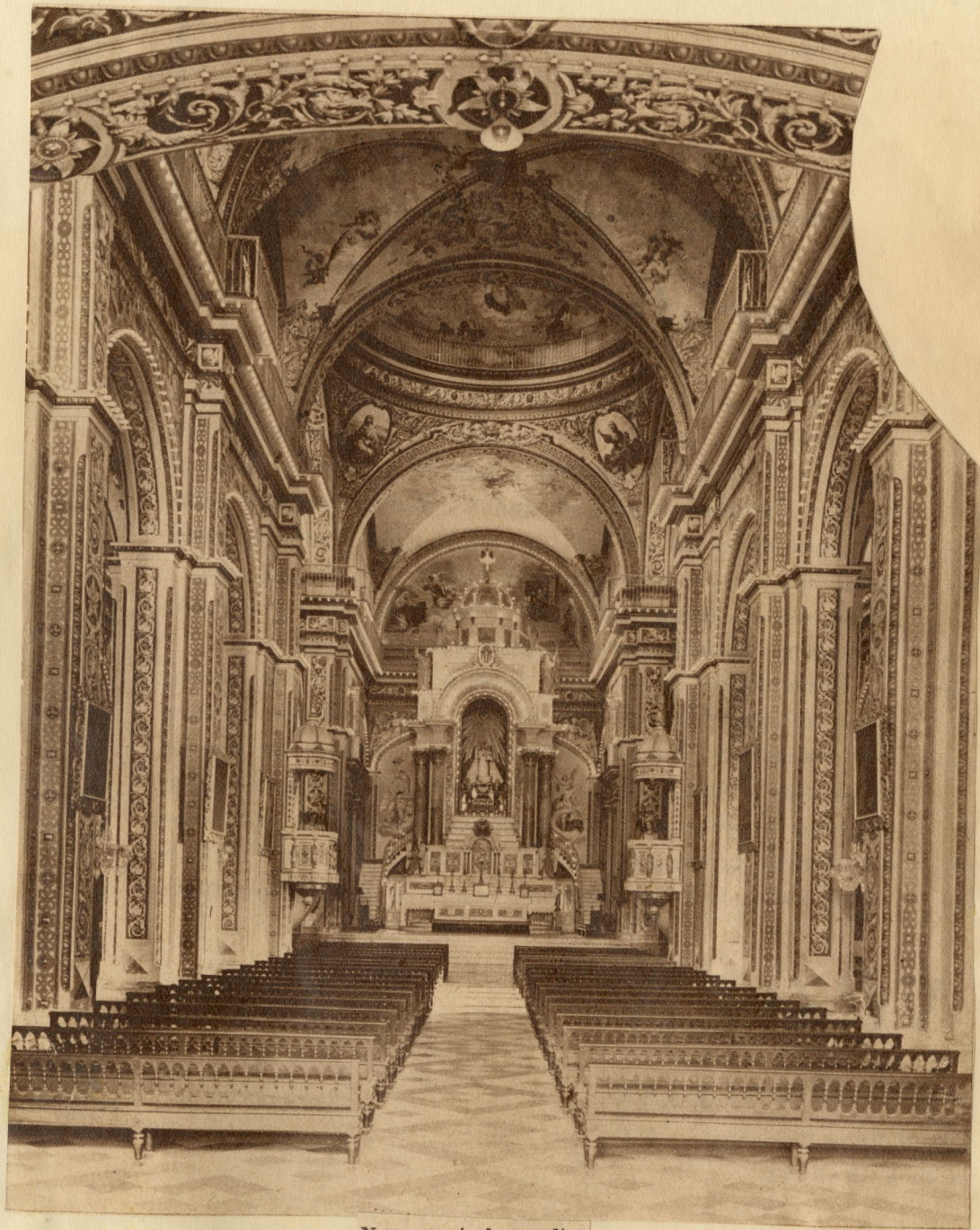
Nave central y altar mayor de la iglesia, donde puede apreciarse el estilo de decoración cultivado por Manuel Lorenzo