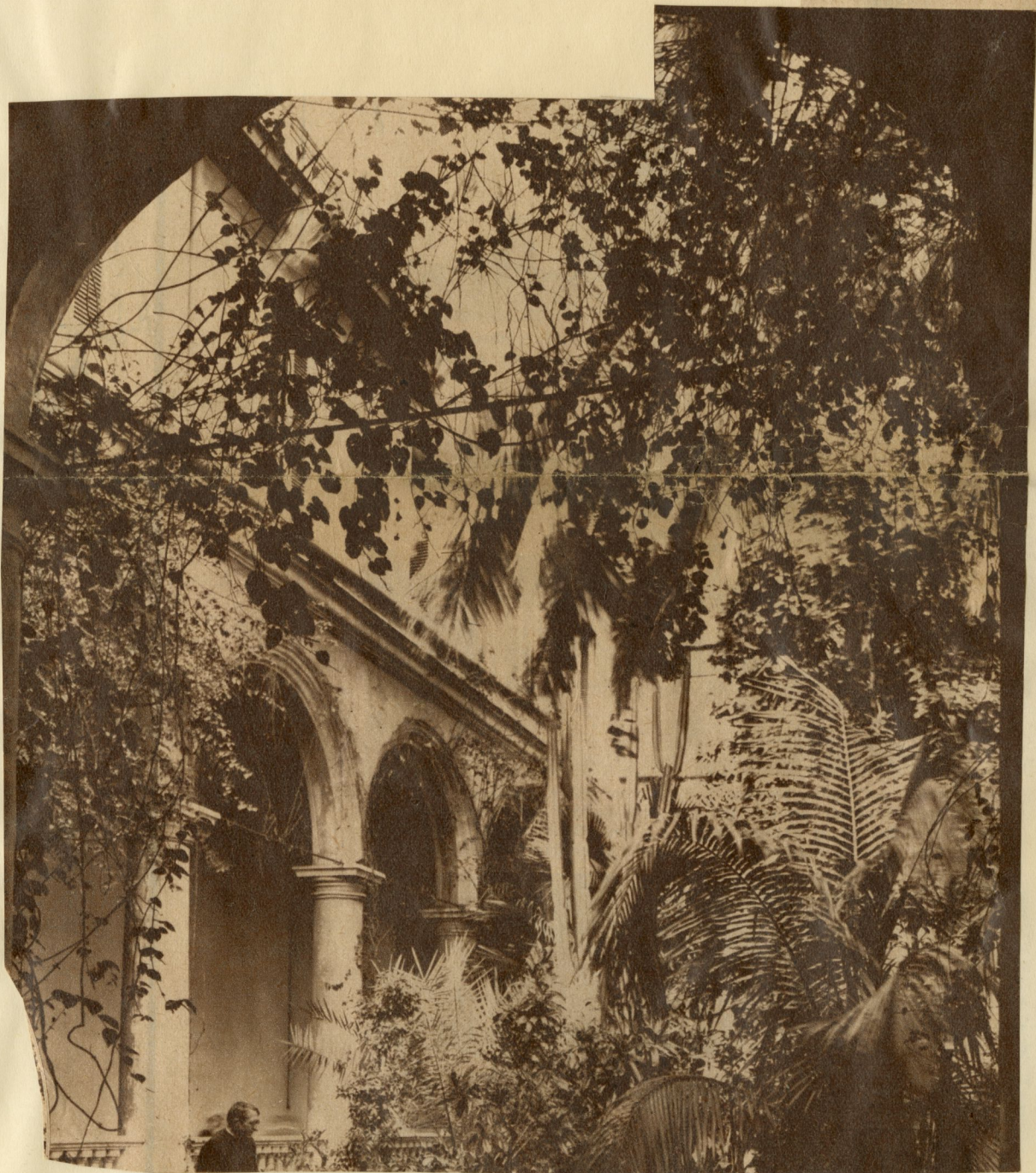
En una tarde de suave luz evoca este patio la vida tranquila de nuestros abuelos