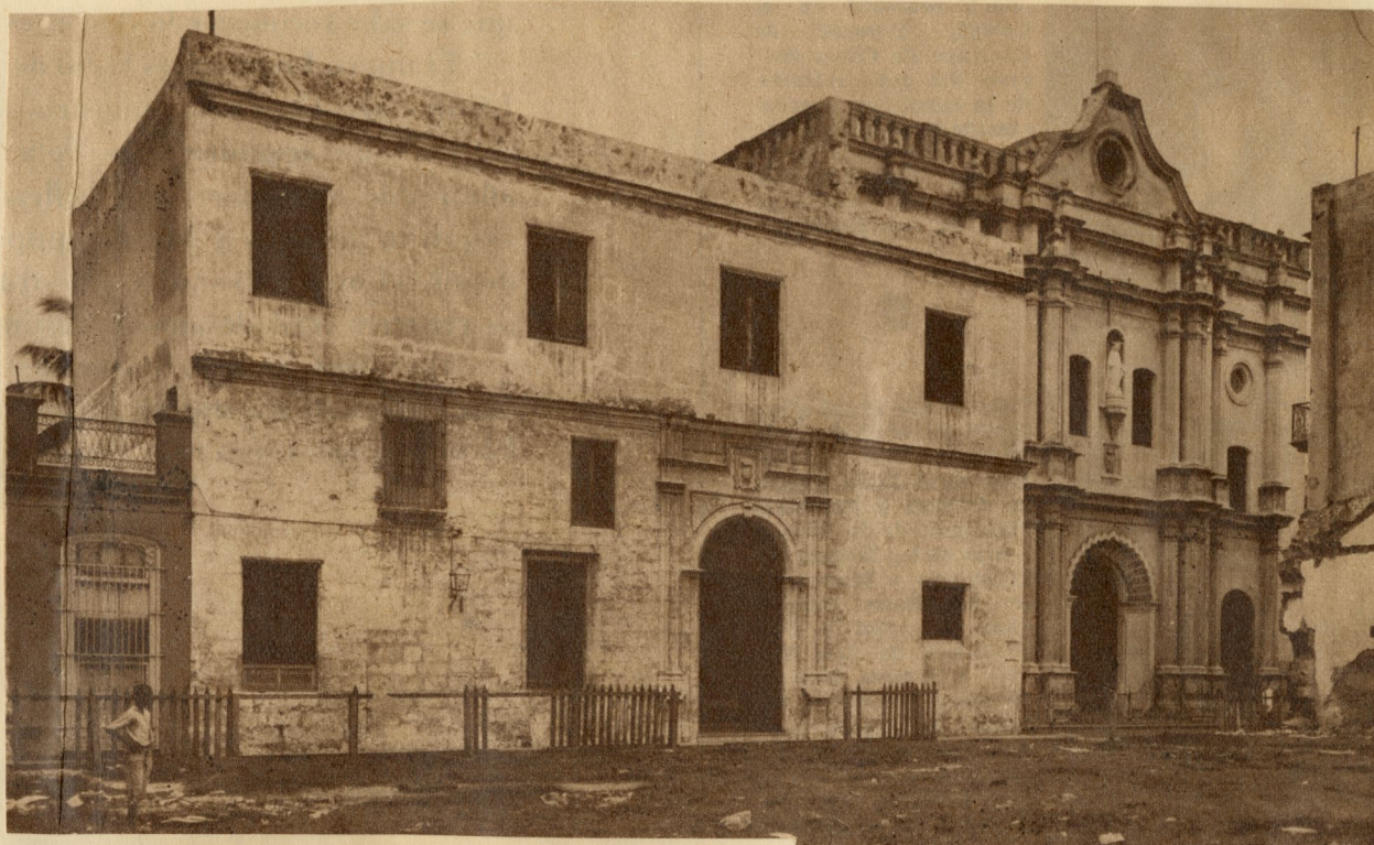
Fachada del Convento e Iglesia de la Merced con el mismo aspecto que presentaba en 1755