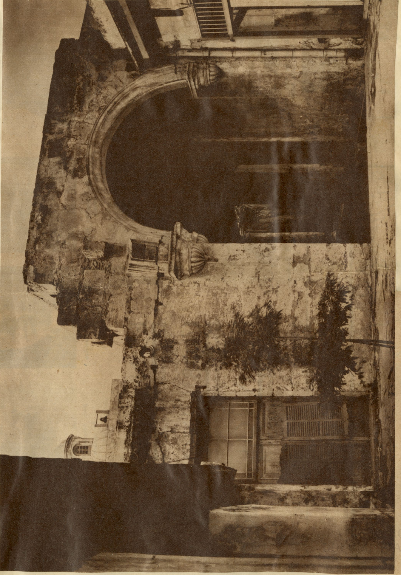
Aspecto de las obras del convento de La Merced, interrumpidas en 1834 a consecuencia de la excomunión de los P.P. Mercedarios