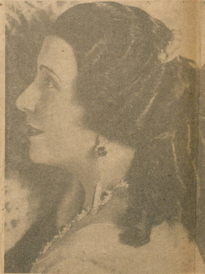
LUCRECIA BORI, figura en el cuadro de grandes artistas de Pro Arte.

La concepción de Pro Arte Musical, su realización factual y el mantenimiento sin concesiones de principios y