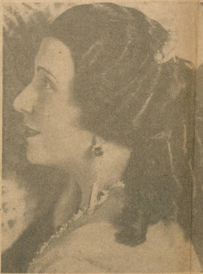
LUCRECIA BORI, figura en el cuadro de grandes artistas de Pro Arte.

La concepción de Pro Arte Musical, su realización factual y el mantenimiento sin concesiones de principios y