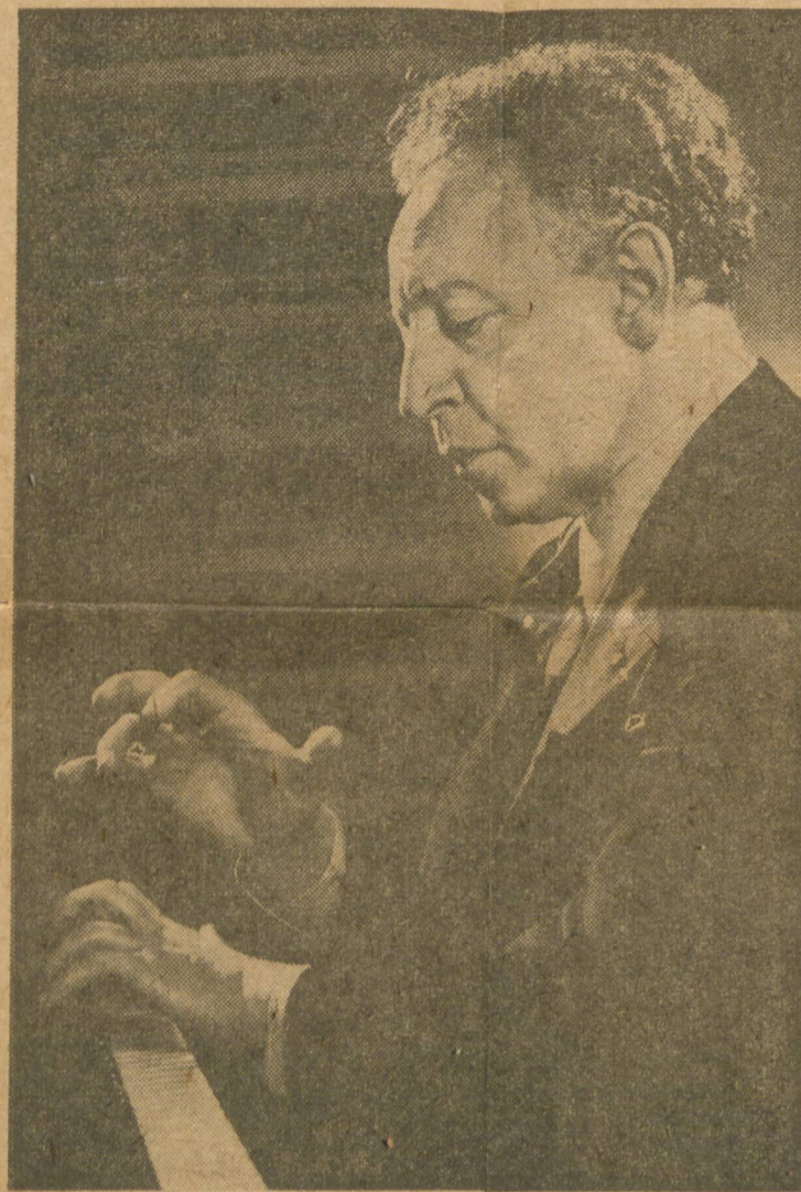
RUBINSTEIN, notabilísimo pianista, contrata-

En los cuarenta años transcurridos la actividad de Pro Arte representa un aporte sin igual al desarrollo y depuración del gusto musical; a la adecuada valoración del canto en sus expresiones más nobles; a la comprensión y el justo aprecio del teatro lírico en sus diversos rengones, tales la ópera clásica en el estricto sentido del término, más el repertorio romántico y las manifestaciones actuales. Y se ha de sumar la creación de la primer escuela de ballet, centro formativo al que deben su iniciación las tres figuras representativas