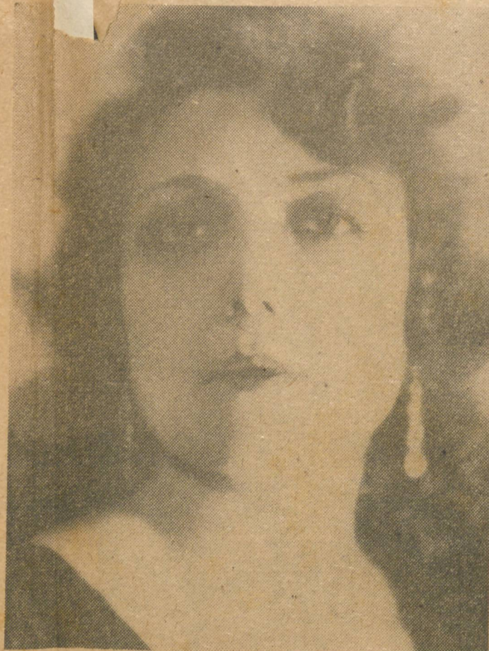
CONCHITA SUPERVIA, gran cantante.

transigencia, el amiguismo y el poco más o menos que distingue la actividad política y la gobernación del país.