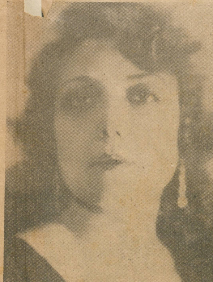
CONCHITA SUPERVIA, gran cantante.