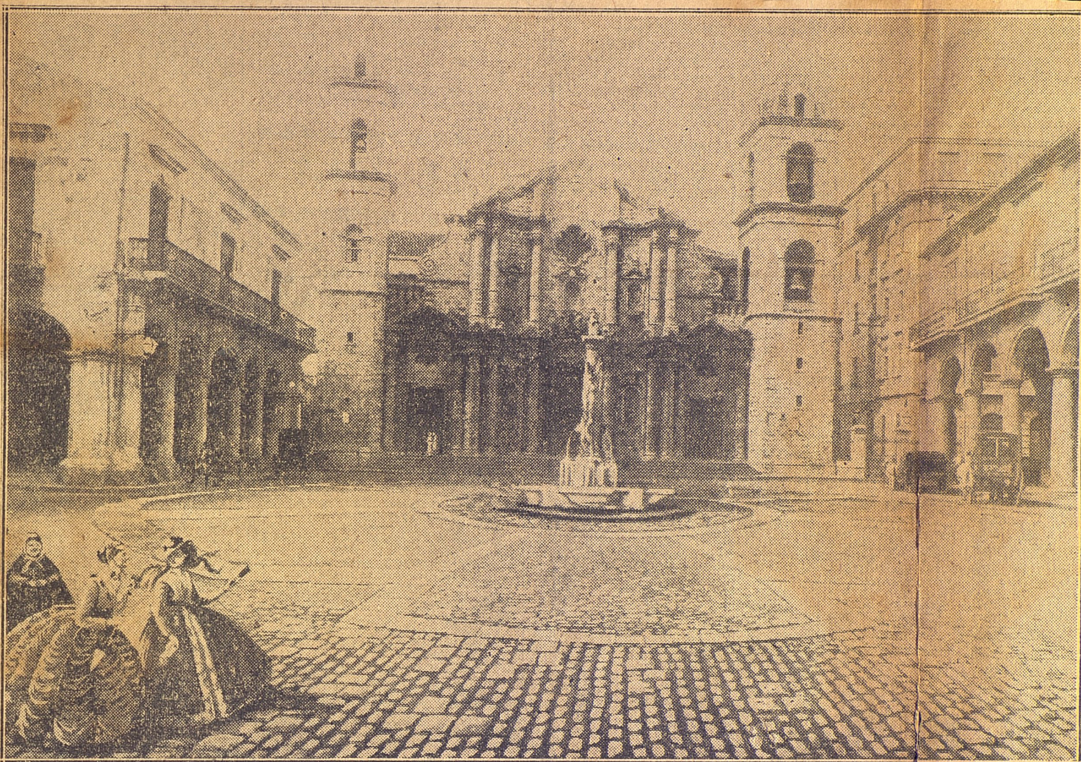
Vista del proyecto de restauración y embellecimiento de la Plaza de la Catedral por el arquitecto francés J. C. M. Forestier.—Al centro de la Plaza irá el lindo monumento que se yergue airoso en la Alameda de Paula. El piso actual será levantado para colocar adoquines grandes y chicos, formando las combinaciones que se ven en la fotografía. Los paramentos de los muros exteriores de las casas que rodean la Plaza serán restaurados también, raspando los de cantería y repellando y pintando de nuevo aquellos que están contruidos con otro material.—Esta Plaza debiera ser declarada monumento nacional y una vez expropiados los edificios establecer en ellos museos colonial de muebles; de libros y revistas; de estampas, litografías &, lográndose con ello una gran atracción para el turismo.