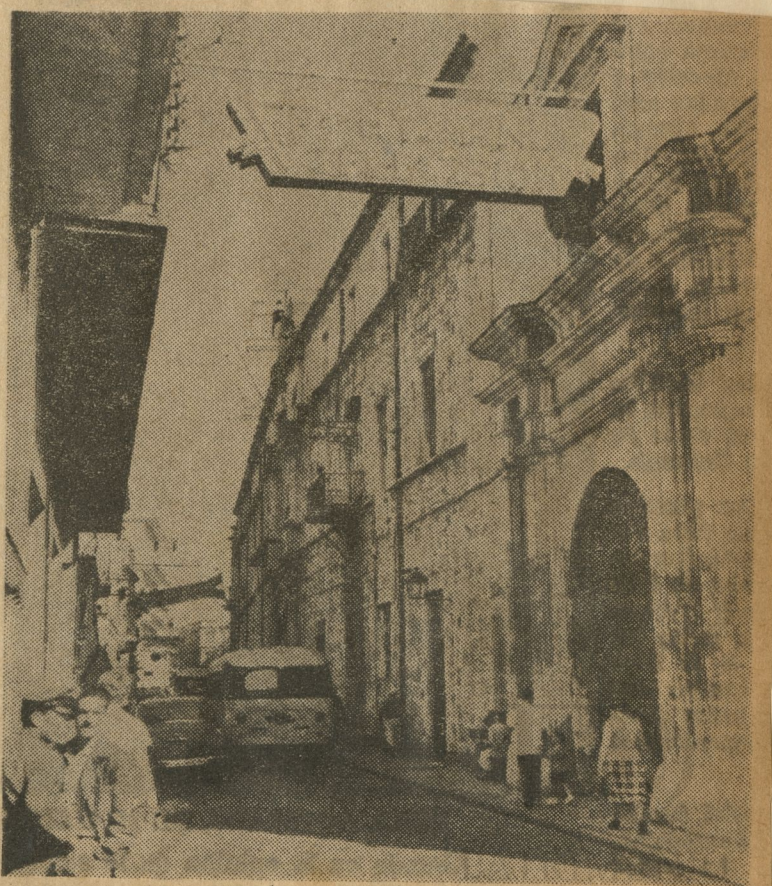
FACHADA DEL edificio del convento de San Francisco, destinado a menesteres administrativos desde hace años.