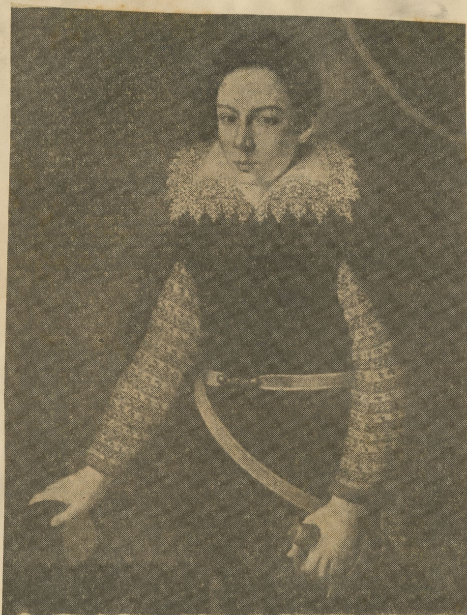
Este retrato de Francisco de Médicis, de serena nobleza, pintado por Christofano Alloris, prueba la gran maestría que habían alcanzado los retratistas italianos de fines del siglo XVI. La precisión del dibujo y la meticulosidad en los detalles no le restan a la obra armonía ni belleza.