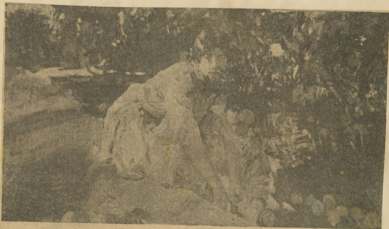
Joaquín Sorolla fué el más ilustre representante del impresionismo en su faceta española. En sus lienzos la luz y el color se orquestan en maravillosas armonías fijadas con una vehemencia y libertad de ejecución que le dieron justo renombre. Nadie como él ha sabido interpretar las luminosidades de las playas mediterráneas y los cabrilleos de la luz en las huertas levantinas. Este cuadro "Muchacha recogiendo manzanas" es característico de su estilo.