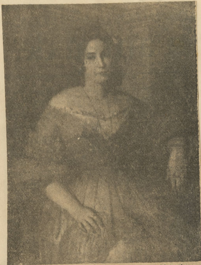
Antonio María Esquivel fué un pintor muy ligado a los escritores de su tiempo, hacia la mitad del siglo pasado. Buen retratista, de trazo apretado, cuidadoso en el color y perfecto terminado de la obra, mereció el aprecio de sus contemporáneos. Este retrato de la Avellaneda, seguramente ejecutado del natural, muestra toda la sabiduría que tuvo de su arte.