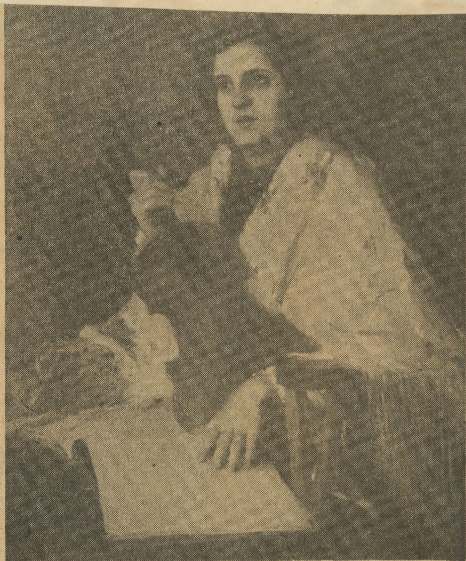
En este lienzo de Romañach "La violinista" se aprecia la gran pureza artística que guió durante su vida toda su producción. Su asombrosa facilidad y dominio técnico también se manifiestan en esta obra.