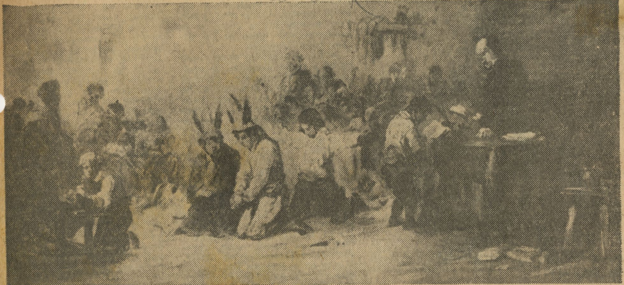
Eugenio de Lucas fué un pintor dotado de una gran inquietud y un temperamento impresionable. La influencia de Goya pesó en su obra con una fuerza tan marcada que anuló su propia personalidad. Los temas y personajes de sus cuadros los buscó en las mismas fuentes que había descubierto el gran maestro de Fuendetodos. En este cuadro "La escuela" el parecido con Goya es tan grande que se presta a equivocación.

Por RAMON LOY dec 19/55 alexis