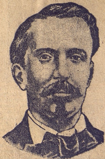
CARLOS MANUEL DE CESPEDES. Padre de la Patria.