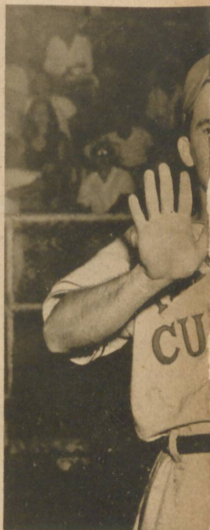
Nuestro repórter gráfico... Se trata nada más de doble-plays de los H base Gallardo, muestran reto de NO PASARAN. pasa nadie.