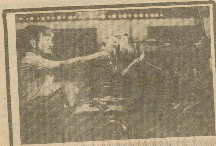
El taller de maquinado desempeña su papel en la recuperación de piezas de repuesto y agregados