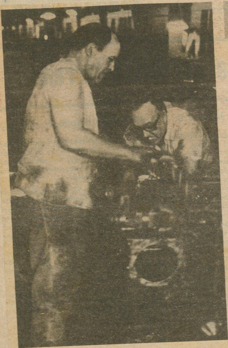
Por CLEMENTE NICADO

REFORZARA EL SERVICIO DE OMNIBUS EN LAS VACACIONES