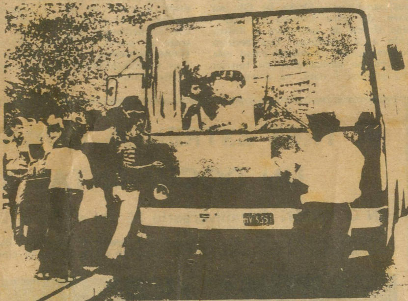
DENTRO DEL PAIS , y en los innovadores, también está la solución a este problema.

Urge ahora junto al apoyo del sindicato, la unión entre la administración en cada terminal y la propia empresa, para resolver en conjunto las limitaciones. Ante la carencia de piezas urge más que nunca organizar y dar cauce a la labor creativa de los aniristas de transporte.