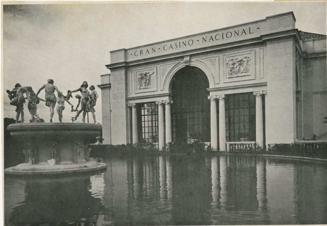
Fuente luminosa del Casino Nacional, obra del escultor italiano Aldo Gamba. Con su penacho de agua iluminado ofrece un efecto fantástico.

los famosos "grands eaux" Versallescos. Así, a los dos grandes grupos tradicionales, o sea, el de las fuentes exclusivamente escultóricas—como las citadas de los Cuatro Ríos, de las Tortugas, de Latona, etc.—y el de aquellas en que la arquitectura se combina y aún predomina sobre la escultura—como la de San Sulpicio, de Grenelle, de los Inocentes, de Trevi, la Paulina, etc.—hay que agregar una nueva categoría, la de las fuentes en que—como las de la exposición de Barcelona—el caudal, los juegos y hasta la policromía de las aguas constituyen su aspecto más interesante.