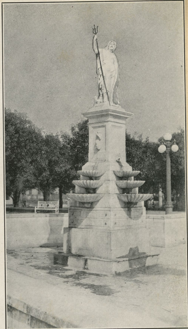
La antigua Fuente de Neptuno, hoy emplazada en el Parque Gonzalo de Quesada en el Vedado, y que anteriormente estuvo en el Museo Nacional conservada como reliquia.

Otras fuentes nos legó la época colonial, como la llamada fuente de "Ceres", la de los "Sátiros", la de las "frutas", etc., que decoraban el Prado, el Paseo de Carlos III, y algunos parques, de mayor o menor mérito artístico, y en las cuales no nos detendremos por yacer hoy mutiladas o haber desaparecido enteramente.