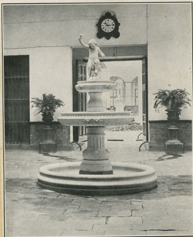
Fuente situada en el patio del antiguo Palacio de Balboa, hoy restaurado y adaptado para Gobierno Provincial. De este tipo de fuente privada hay muchas en las viejas casas cubanas.

En las fuentes de la era Republicana, la del Casino Nacional, por el competente y célebre Aldo Gamba, es una composición bellísima y original, aunque recuerdo una obra semejante, la "Depew Memorial Fountain", por el escultor Sterling Calder y el arquitecto Henry Bacon, los dos norteamericanos; en ambas una "rueda" de hermosas y gráciles danzarinas, cogidas de la mano circundan la taza, sólo que, en el caso a que me refiero, se eleva un árbol central sosteniendo una figura de la Música, batiendo nerviosamente los platillos. La originalidad de la fuente de Aldo Gamba—quien probablemente no conocía la obra mencionada—estriba, de todos modos, en haber contado con el agua como elemento fundamental de la composición: sus mujeres, rebosantes de juventud y alegría, danzan en torno al vaporoso penacho de agua cual si festejaran al unísono el triunfo de la vida y la gloria del amor.