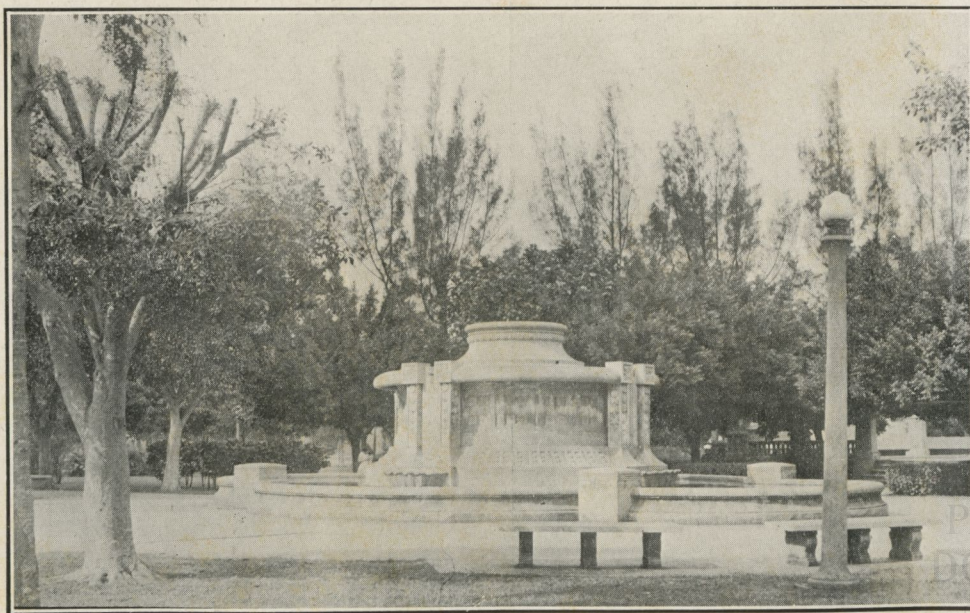
Fuente Luminosa en el Reparto Miramar, proyecto de los arquitectos de jardinería Luetchford y Jiménez.