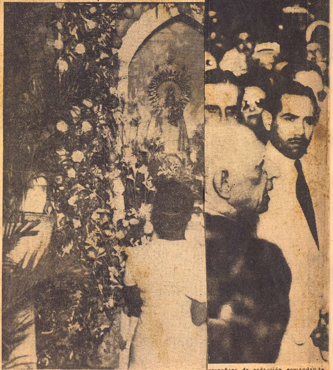
En la capilla rústica construida para una imagen de la Virgen adornada ayer con motivo de