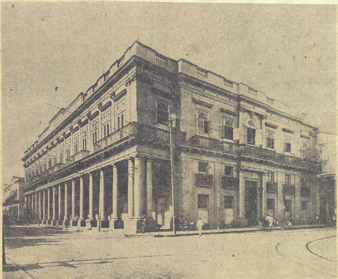
Fotografía del Palacio de Aldama, ejemplo de estilo neoclásico en la Habana. (1838).

...o vicinal de Jaruco en cone- sí donde continúa próximo a la