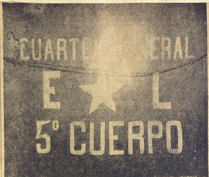
"...se le ve glorioso cuando lucha por la independencia de la Patria". Banderin del Quinto Cuerpo del Ejército Libertador a cargo del cual estuvo la hazaña de Tunas.