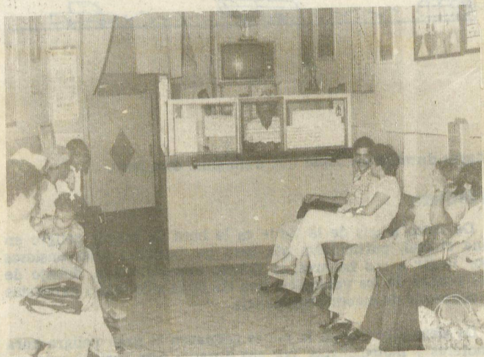
La agencia de Remedios, por dentro.