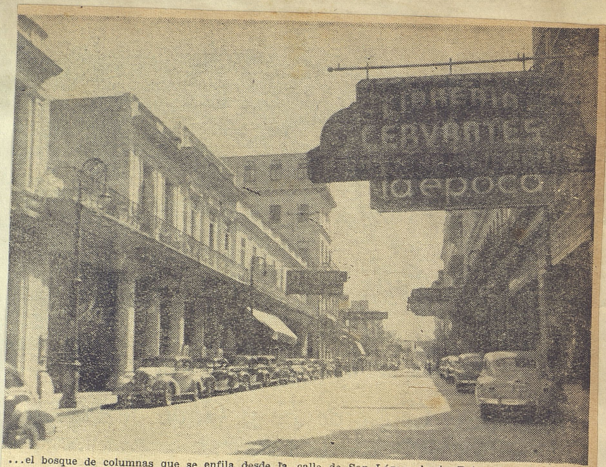
...el bosque de columnas que se enfila desde la calle de San Lázaro hasta Reina, también se re- moza y trata de vencer en donaire a sus paralelas.