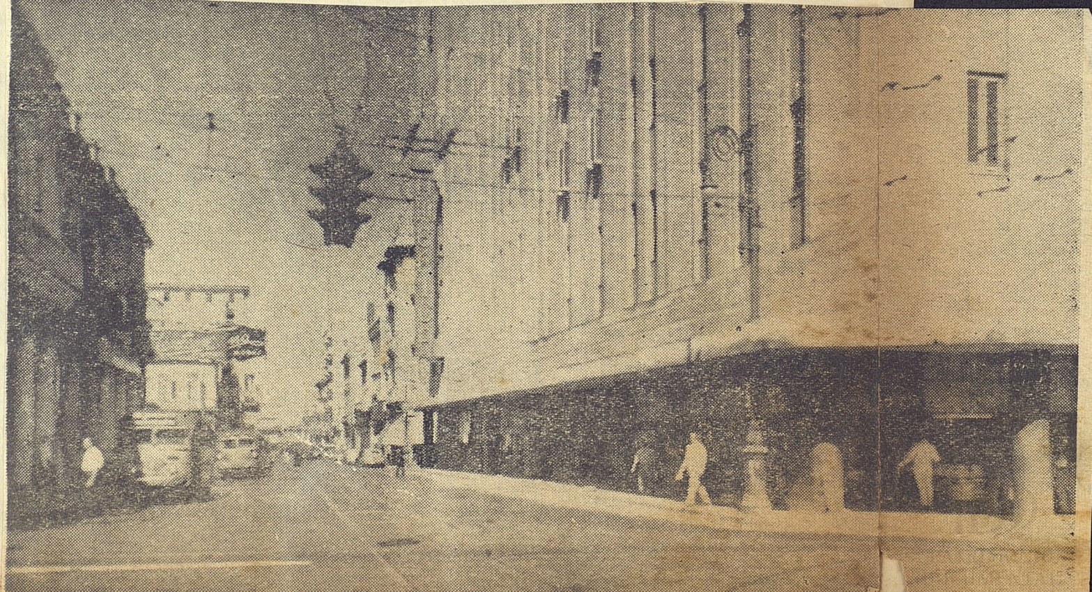
Galiano, ancha y recta, paulatinamente se perfila en líneas aerodinámicas arquitectónicas...