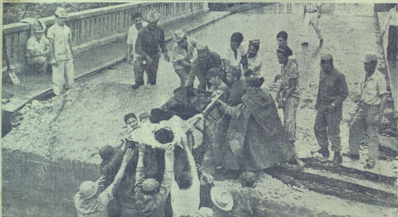
Una mujer rescatada a la que había que hacerle urgentemente la cesárea, es transportada en una camilla por miembros del Ejército y vecinos del lugar, por sobre las ruinas del destruido puente Mir, momentos después del cruce del huracán por la provincia de Oriente. Fue una labor verdaderamente dificultosa y arriesgada, pero que logró llevarse a cabo felizmente poniéndosele a salvo. En Mir las aguas y los fuertes vientos originaron grandes pérdidas, pero allí al igual que en el resto de las zonas afectadas el pueblo demostró un alto espíritu.