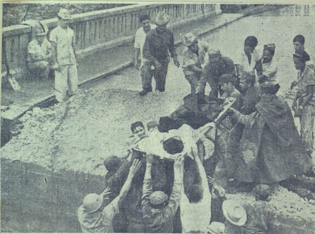
Una mujer rescatada a la que había que hacerle urgentemente la cesárea, es transportada por los miembros del Ejército y vecinos del lugar, por sobre las ruinas del destruido puente a cruce del huracán por la provincia de Oriente. Fue una labor verdaderamente difícil que logró llevarse a cabo felizmente poniéndosele a salvo. En Mir las aguas y los grandes pérdidas, pero allí al igual que en el resto de las zonas afectadas el pueblo

las operaciones de salvamento y auxilio. La cooperación de la Cruz Roja Cubana y de otras organizaciones de masas ha sido extraordinaria. Pocos horas después, con el Presidente de la República partieron los ministros relacionados con las labores de reparación de los daños causados. Puede afirmarse que el Gobierno está haciendo los mayores esfuerzos en ese sentido. Nuestro pueblo se ha enfrentado con decisión y coraje a esta adversidad. En medio de su dolor, Cuba ha sentido la satisfacción de ver cómo la solidaridad humana se ha desarrollado a lo largo de todo el mundo, expresándose en testimonios de condolencia y ofertas de ayuda.