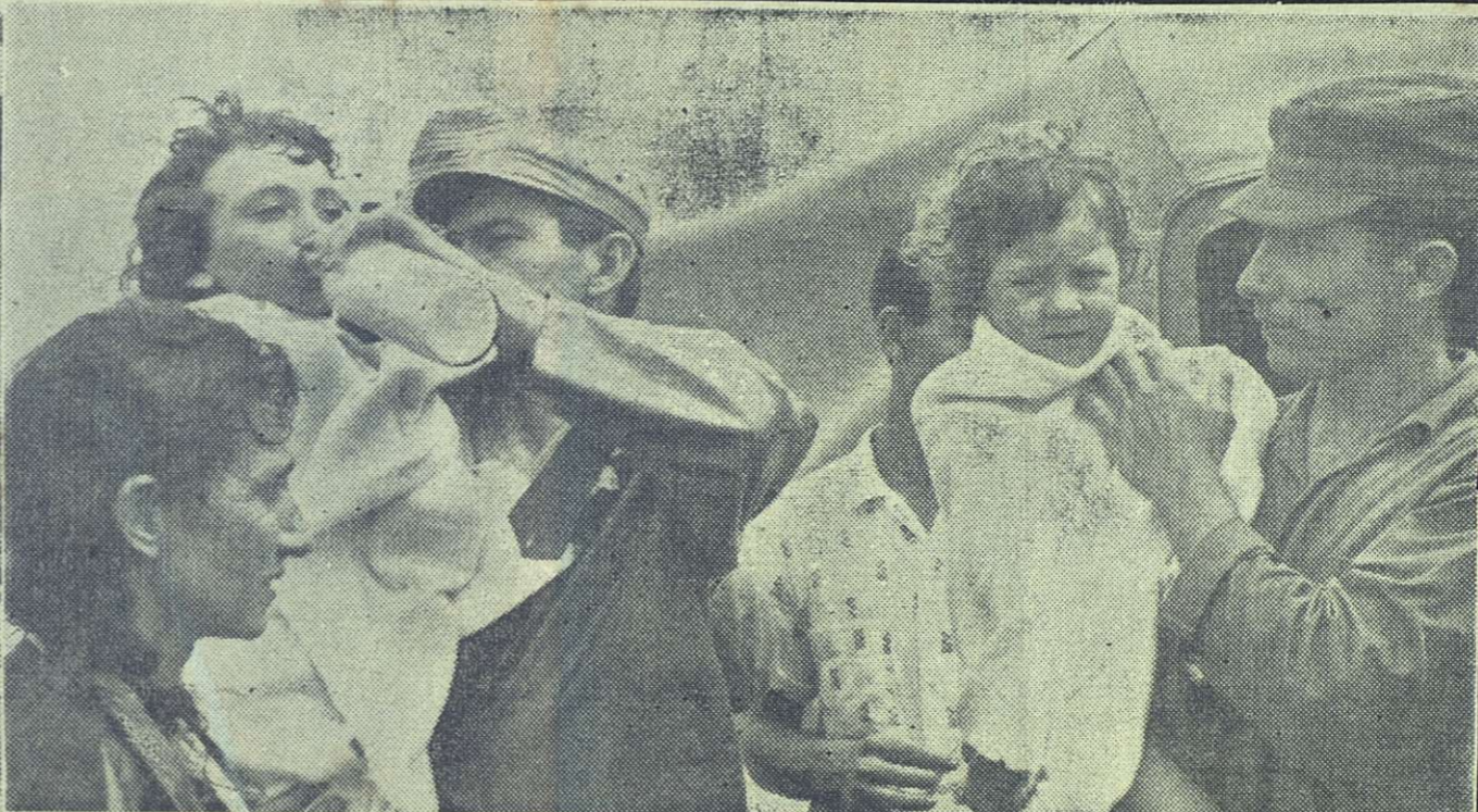
Miembros del Ejército Rebelde sostienen en los brazos y brindan toda clase de atenciones y cuidados a dos niñas rescatadas momentos antes junto con la madre de una de las zonas inundadas de la provincia de Oriente, donde habían permanecido aisladas durante largas horas. Uno de los miembros del Ejército suministra leche en biberón a la menor de las niñas, su primer alimento desde el momento en que las aguas del Cauto las dejaron sin hogar, mientras la madre, con la angustia aún reflejada en el rostro, contempla la tierna escena.