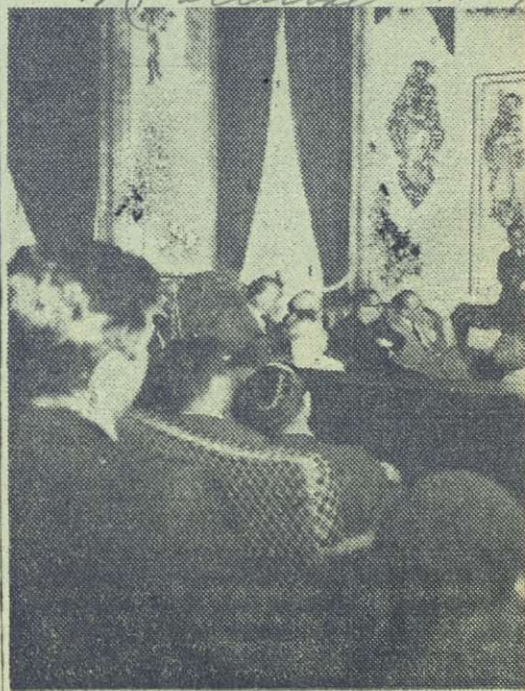
Rea con el Cuen

Francia, pues el asunto para el cosmonauta ren grandes esfuerzos y inmediato. Afirmó que si la tica, Estados U