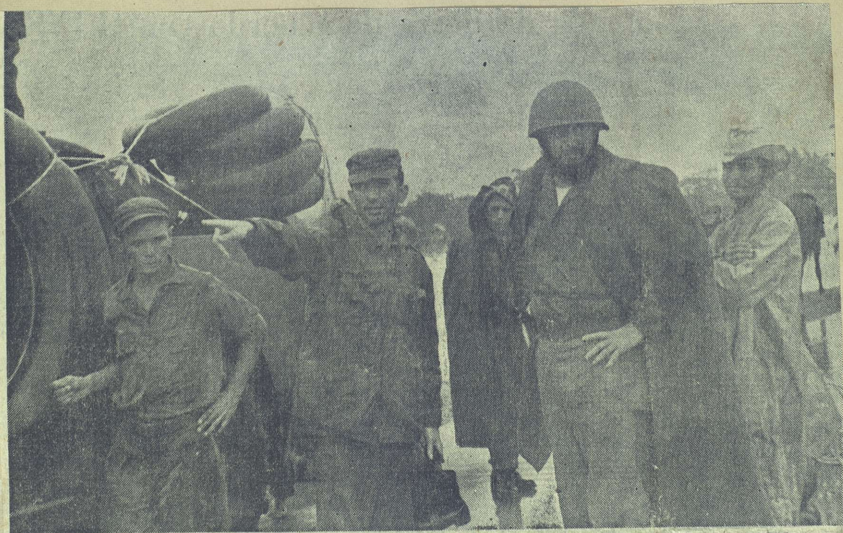
En la zona de El Naranjal, en la provincia de Oriente, el primer ministro del Gobierno Revolucionario y primer secretario del PURSC, comandante Fidel Castro, dirigió los preparativos para la salida de los tanques anfibios hacia el Cauto, a fin de inspeccionar todo el área inundada y socorrer a las familias que permanecían aisladas por el desbordamiento del río, a consecuencia del huracán que azotó a dicha provincia y a la de Camagüey, durante cinco días. Más fotos en las páginas 2, 5, 8 y 12.—(Foto Tolosa).