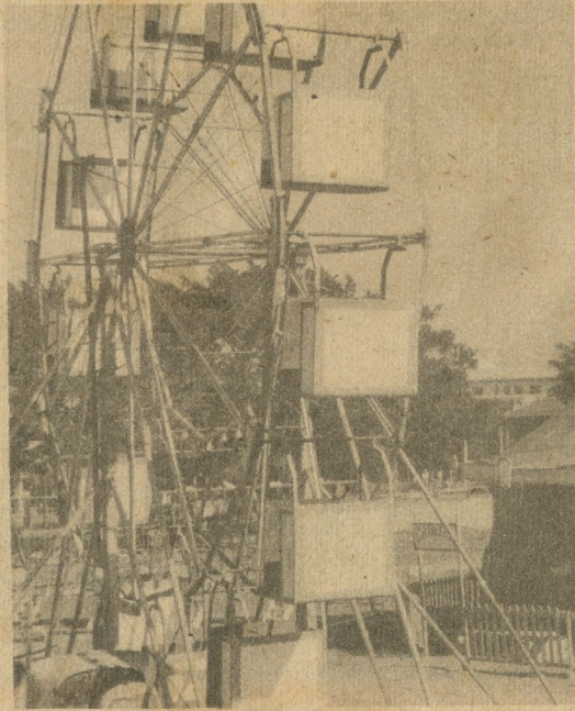
Parque de Porvenir y Lawton.