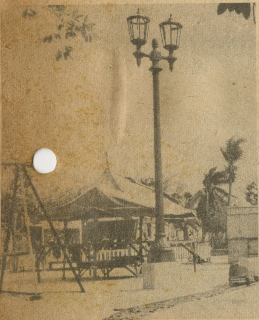
Parque del Anfiteatro Municipal.