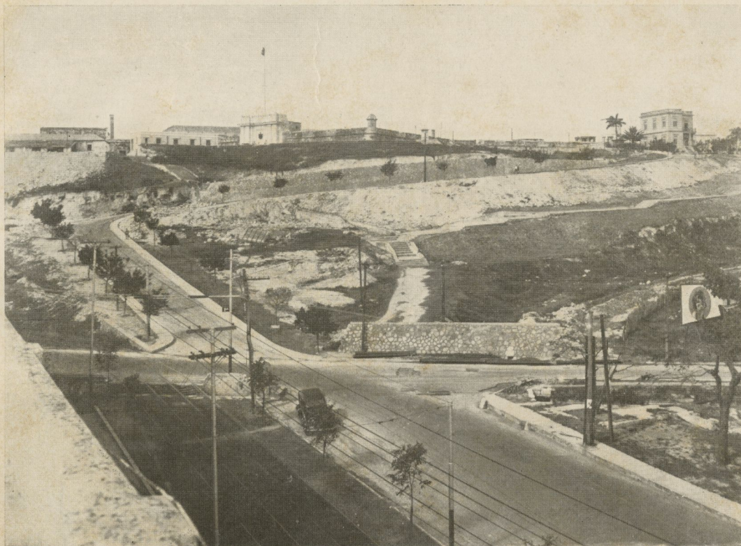
El Castillo del Príncipe visto desde la Avenida de Carlos III

rante más de dos meses en el terreno, auxiliada siempre por empleados del Negociado de Construcciones Civiles, a fin de obtener toda topografía y nivelación del terreno tal como existe actualmente; cuestión ésta inevitablemente previa, para saber a qué atenerse en cuanto a la adaptación del proyecto de Forestier.