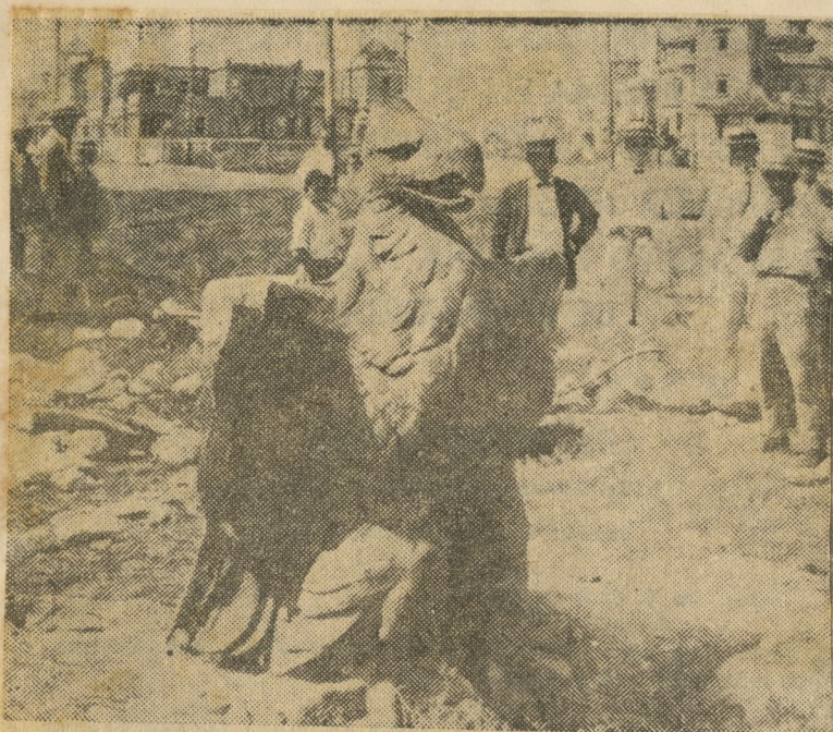
...el águila quedó con las alas rotas y una como expresión de sorpresa y escándalo en el pico...