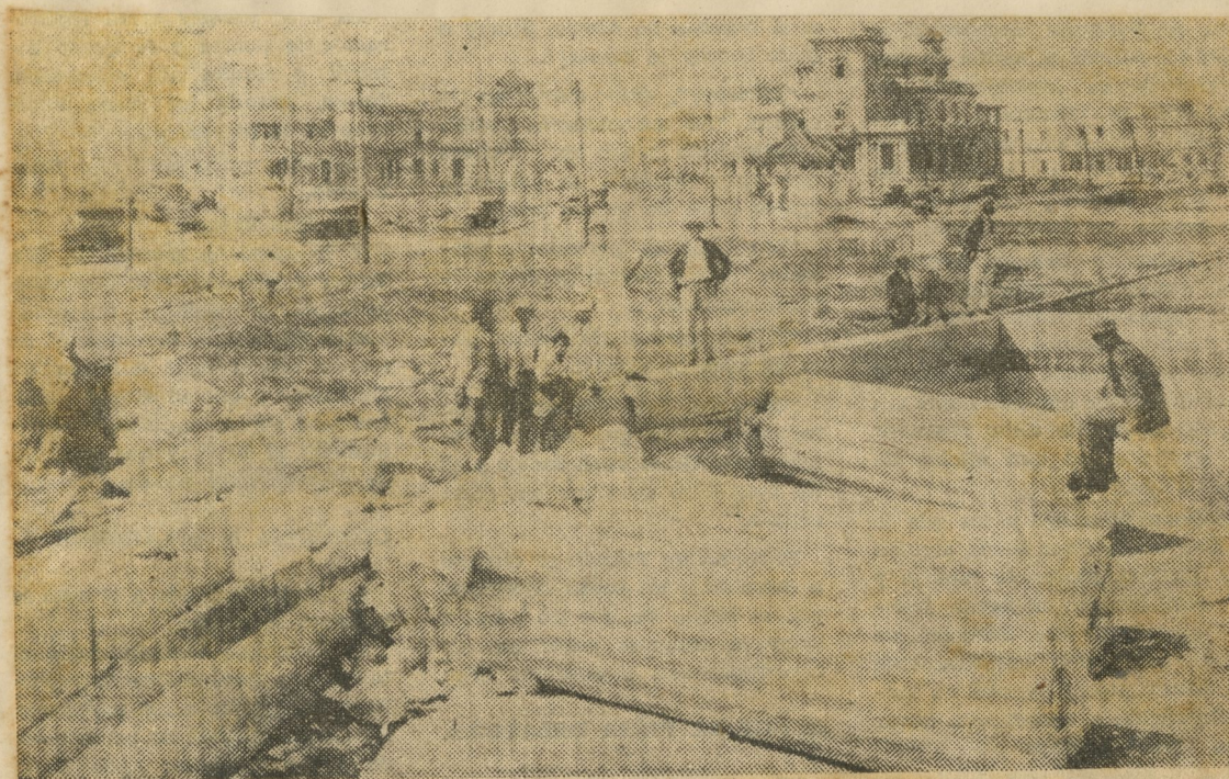
...ruinas del primitivo monumento al "Maine" tal y como quedaron al paso del memorable ciclón de Oct. 20 de 1926.