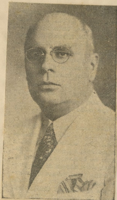
... el Arquitecto Gustavo Moreno Lastres, Ministro de O. P. en 1944-45, quien donó a la Embajada Americana el Aguila del primitivo monumento al Maine que por algún tiempo estuvo colocada en el patio del convento de Santa Clara.