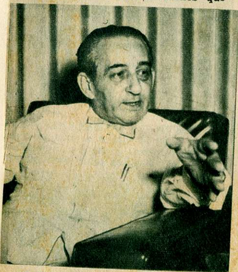
"Influye el retraimiento de los turistas norteamericanos".

—Indudablemente —agrega— en dicho descenso ha influido la situación de intranquilidad que existe en el país que aunque es circunstancial se deja sentir sobre todo, en este tipo de negocio en que la clientela se limita a tres o cuatro mil familias que son las que principalmente constituyen la clientela de los grandes restaurantes. Ha influido también el retraimiento experimentado en los turistas norteamericanos que