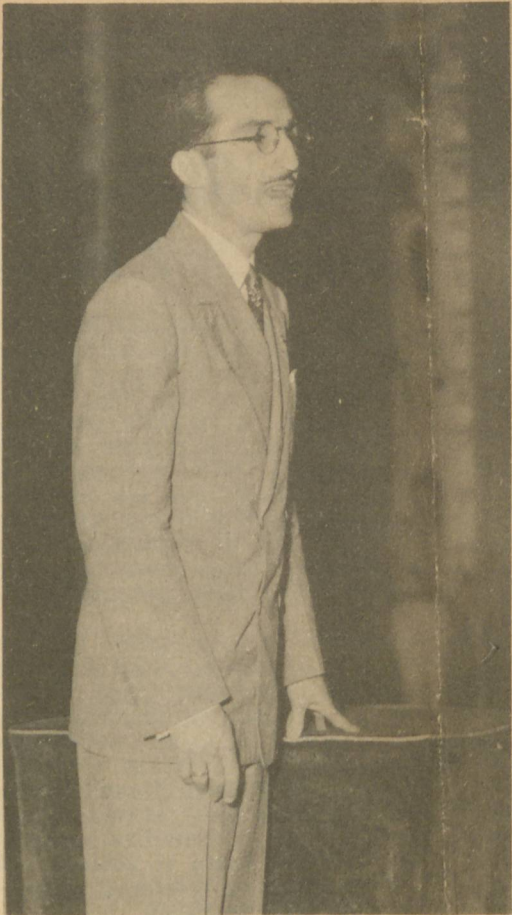
MANACH EN LA HISPANOCUBANA. —Jorge MANACH, una de las primeras figuras de la intelectualidad cubana, ex secretario de Educación, líder abecista y en la actualidad profesor de la Universidad de Columbia (E. U.), disertando el domingo 14, ante los miembros de la Institución Hispanocubana de Cultura, en el teatro Martí. El ilustre escritor dió a sus oyentes un panorama y una interpretación del momento actual en los Estados Unidos.