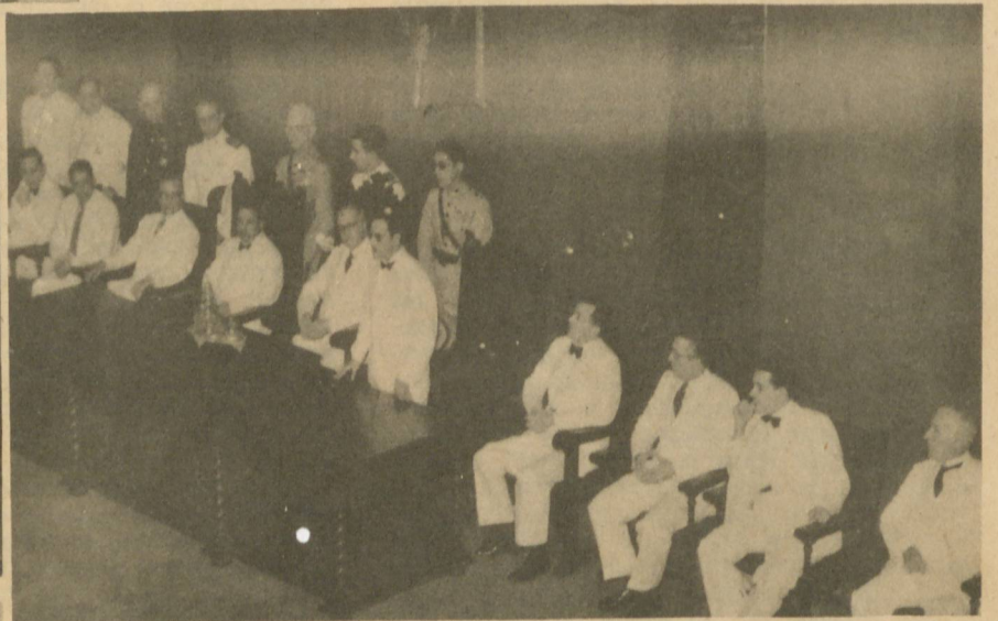
El claustro de profesores que asistió al acto de apertura de la Universidad Nacional, y que fué presidido por el doctor BARNET.