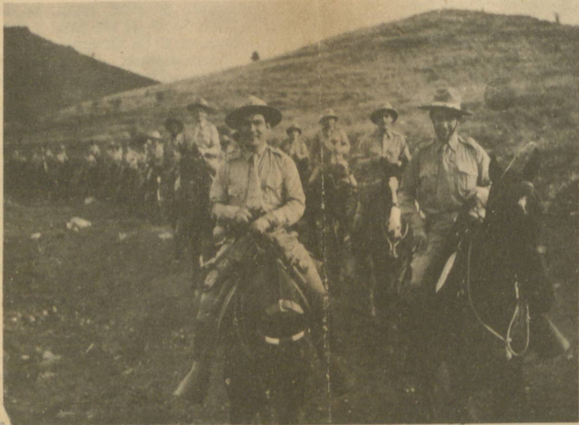
LAS MANIOBRAS MILITARES. —El jefe del Estado Mayor del Ejército, coronel Fulgencio BATAISTA, al frente de la columna de caballería que está realizando maniobras en la zona de Trinidad.