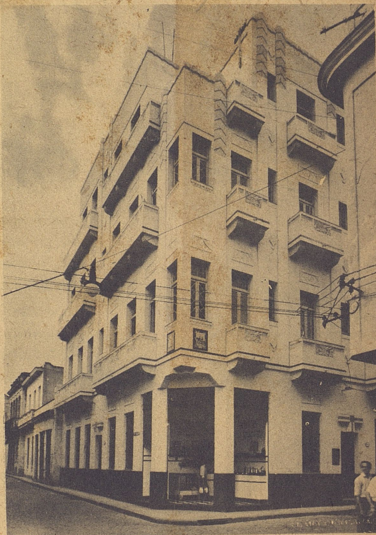
¿Saben ustedes dónde está "esto"? En la esquina de Cuba y Paula, en el corazón mismo de La Habana antigua.

¿Qué les parece este cajón sin gracia junto al viejo balcón colonial de al lado? Si la foto no basta, vayan a Empedrado entre Cuba y San Ignacio.