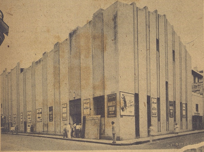
¿Una casa o un cajón? Esto es un teatro, y el Municipio aprobó sus planos.

tido más amplio y más de acuerdo con sus finalidades verdaderas.