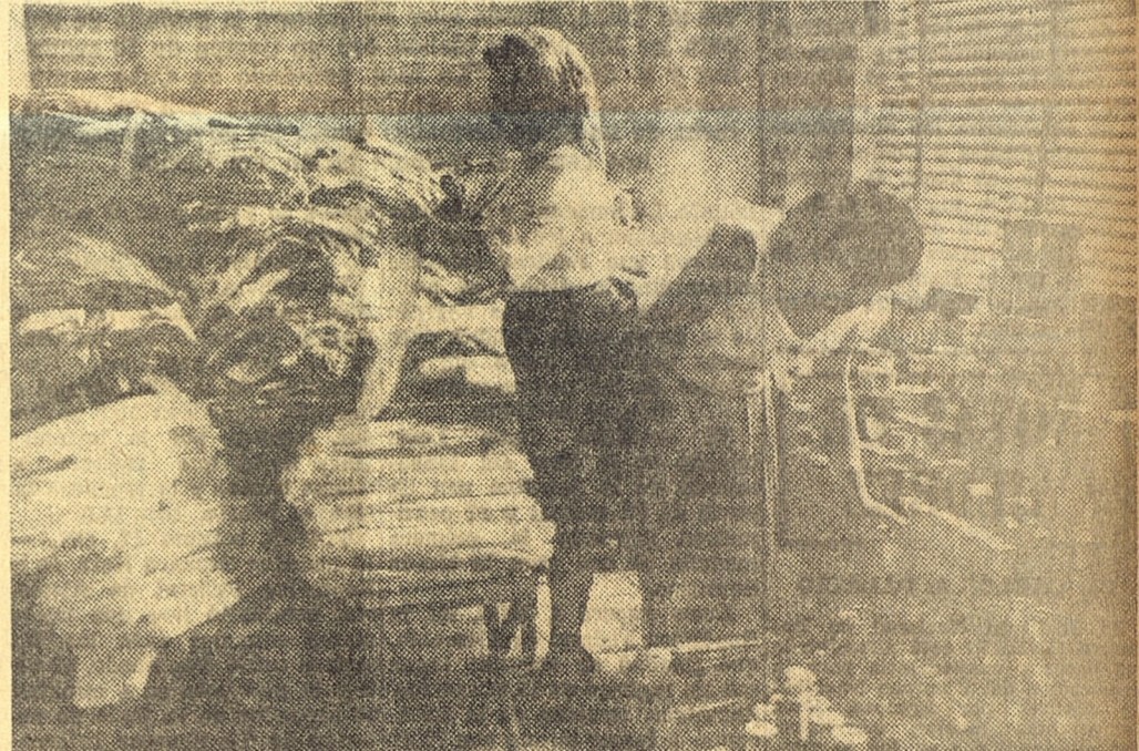
Parte de los aportes recibidos en el Consejo Provincial del Sindicato de Trabajadores Gastronómicos de La Habana.