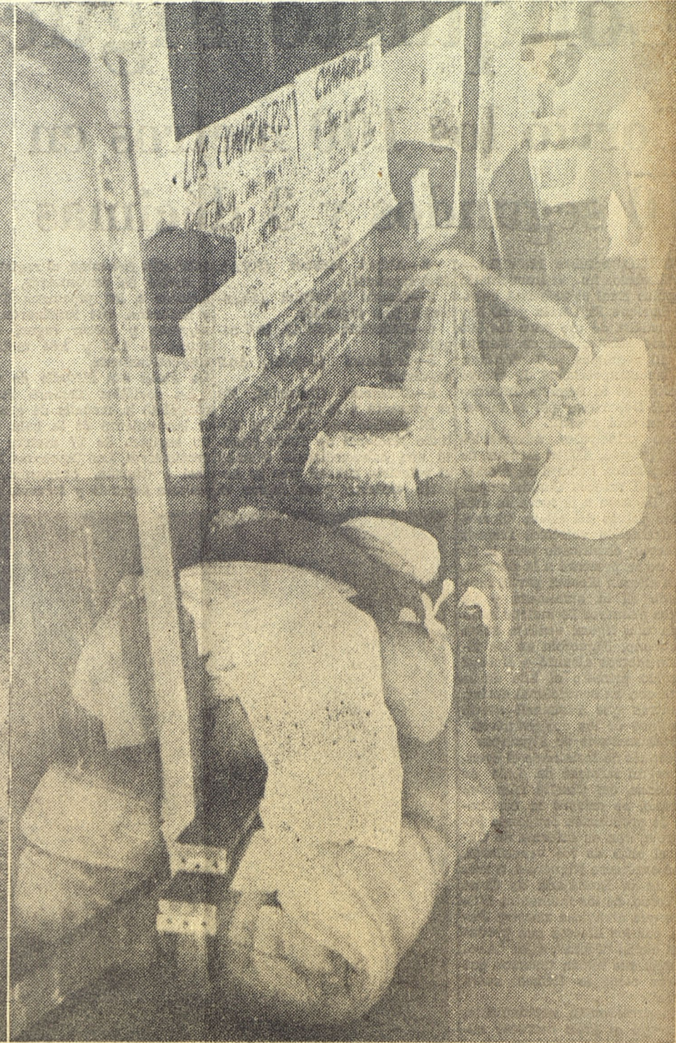
En los locales de recepción, la ropa que llega con algún descosido se cose inmediatamente por trabajadoras voluntarias, lo mismo a mano que a máquina, para enviarla sana a las zonas afectadas por el ciclón, y se clasifica cuidadosamente para su mejor empleo.