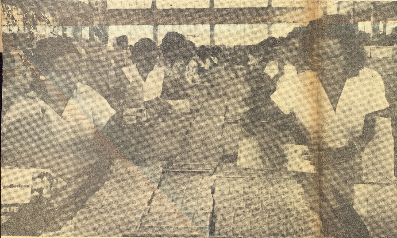
Los trabajadores de la fábrica "Gerardo Abreu Fontan", antigua La Estrella, también laboran horas extras para aumentar la producción y enviar galletas y chocolate a las víctimas del ciclón.