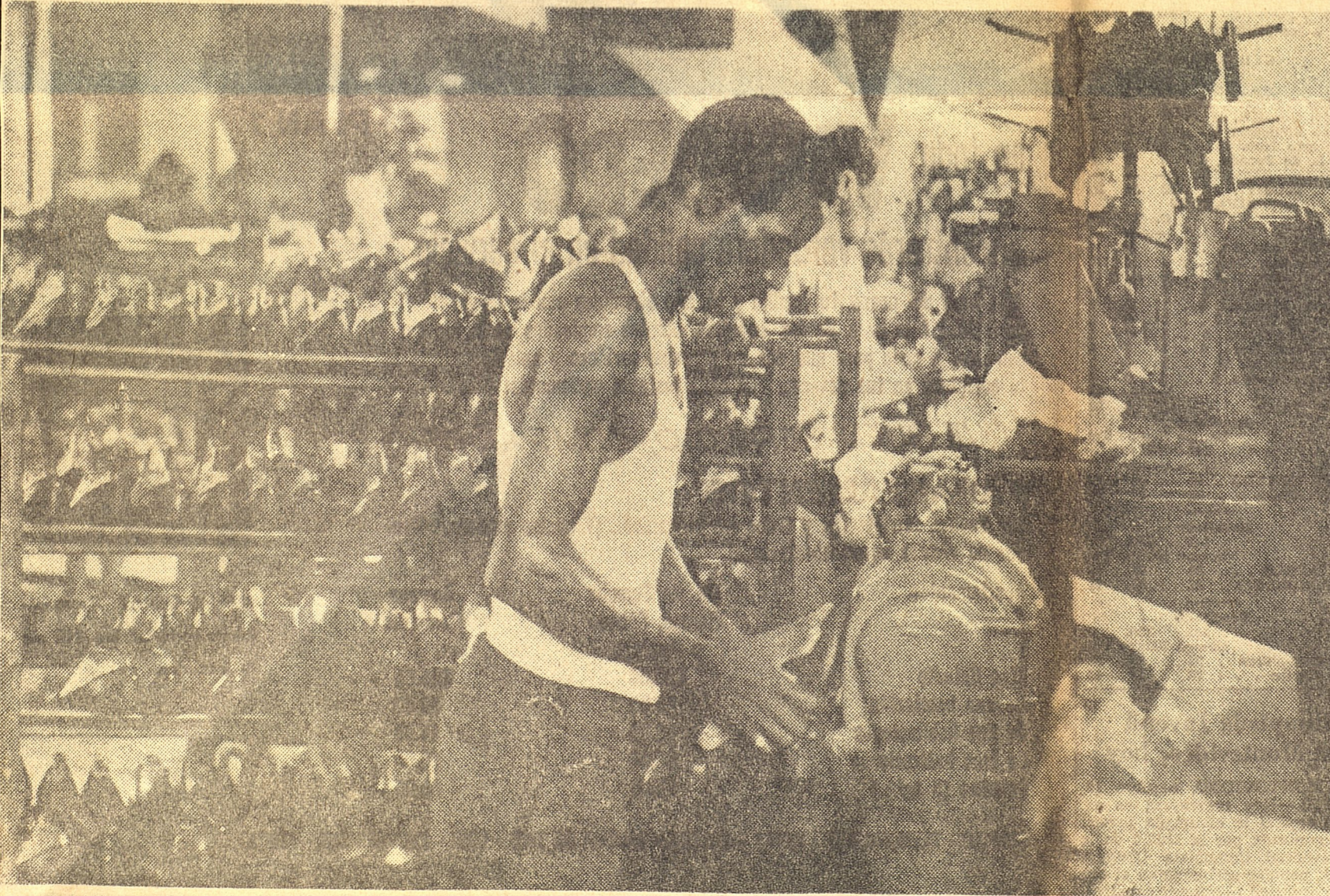
Taller 206-01 (antigua Renois) de la Empresa Consolidada del Cuero, donde los obreros hacen 150 pares de zapatos diarios extras para enviarlos a los damnificados.