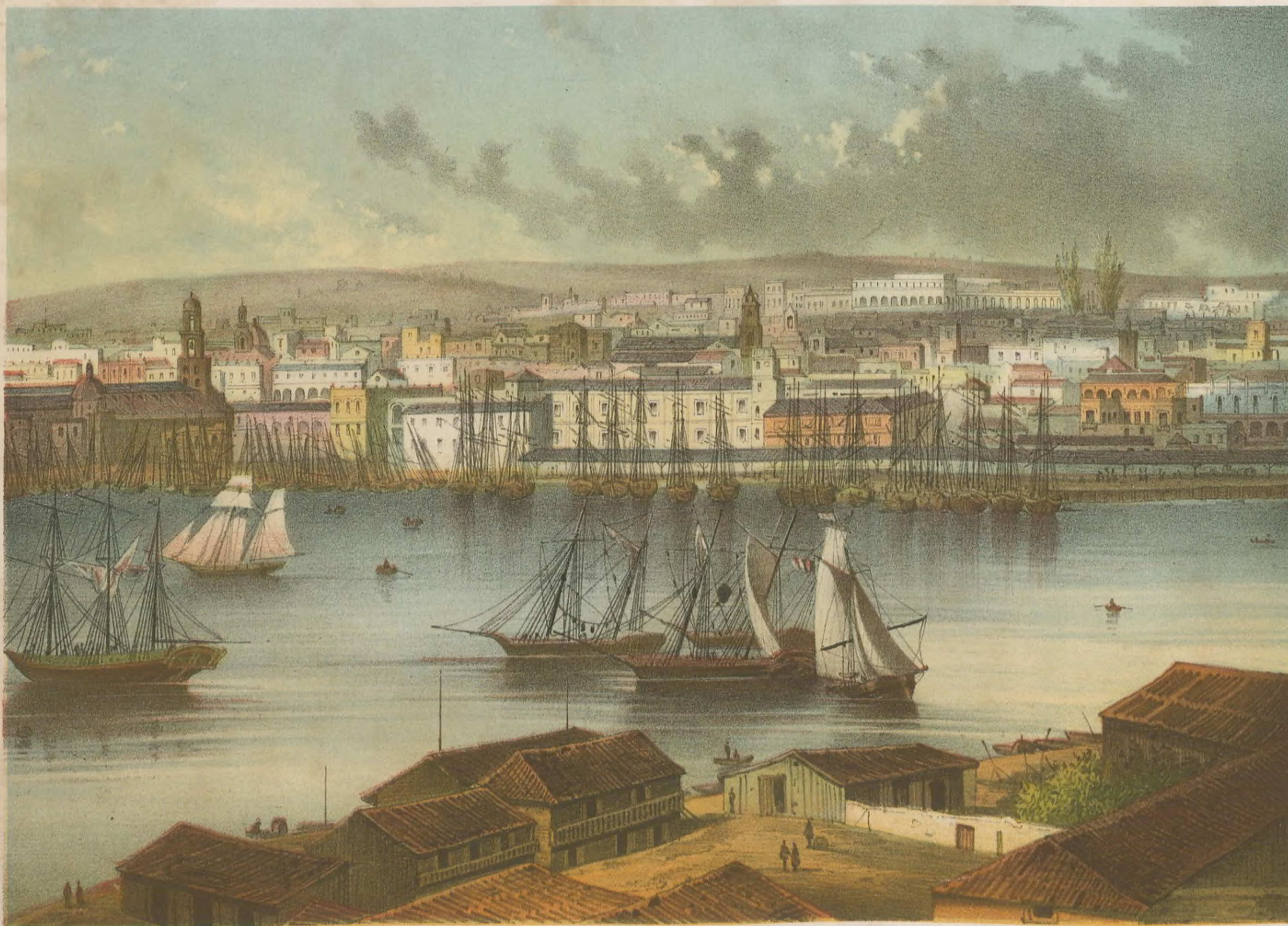
HABANA 2ª Vista tomada desde Casa-Blanca.