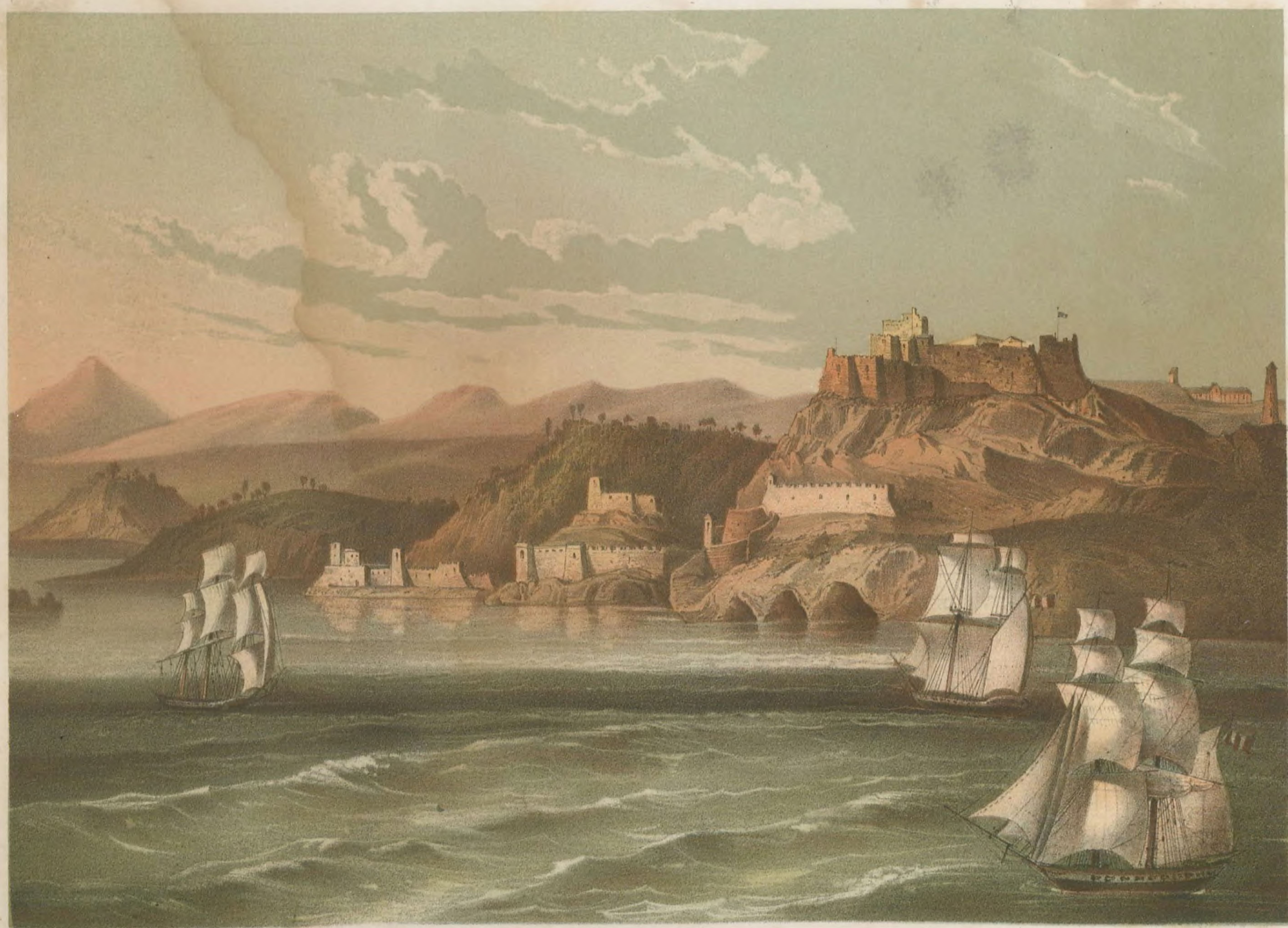
MORRO Y ENTRADA DEL PUERTO DE SANTIAGO DE CUBA Morro Castle & Entrance of the port of Santiago de Cuba