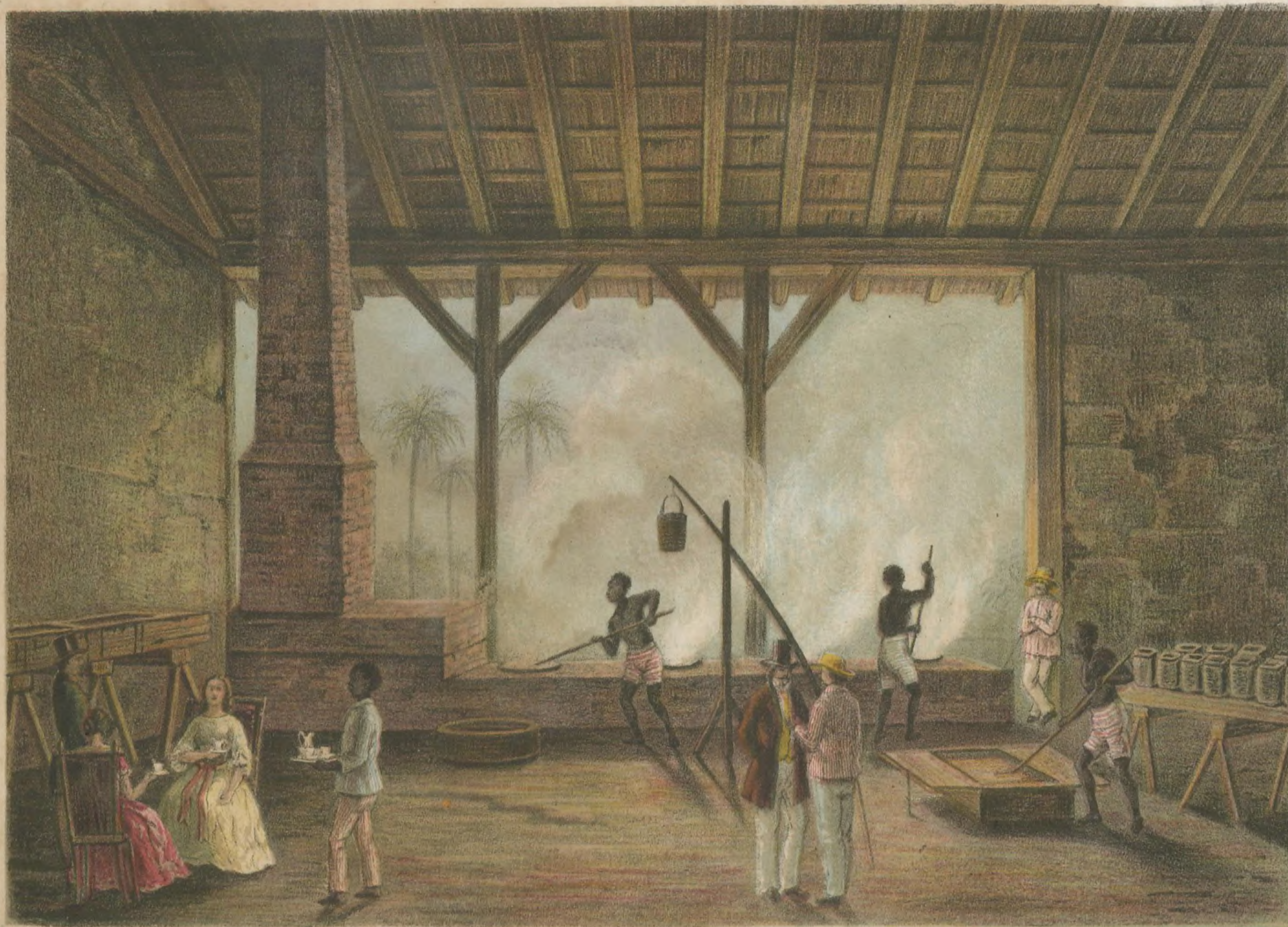
VISTA DE UNA CASA DE CALDERAS.