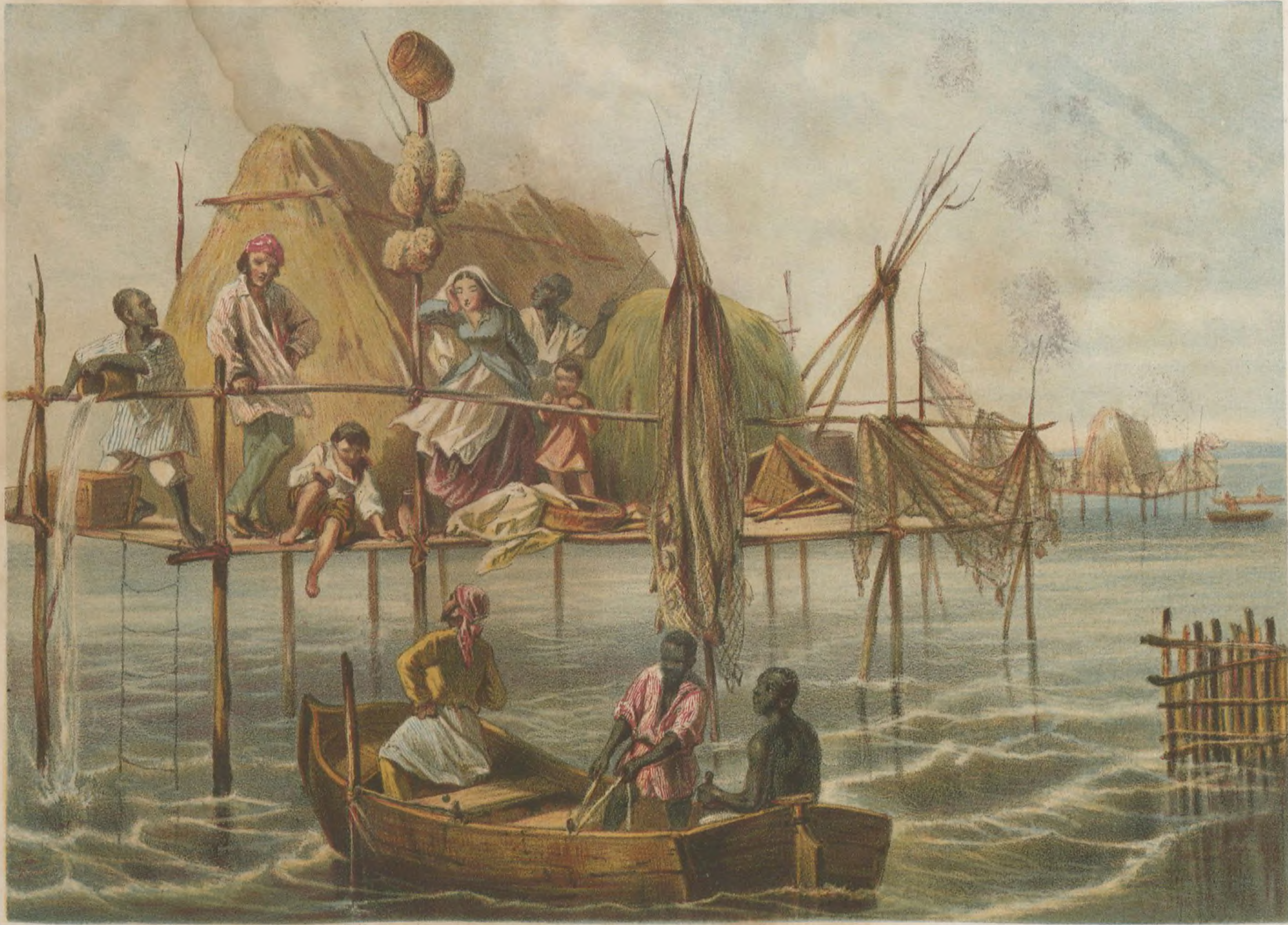
VIVIENDA DE LOS PESCADORES DE ESPONJAS Bahia de Nuevitás.