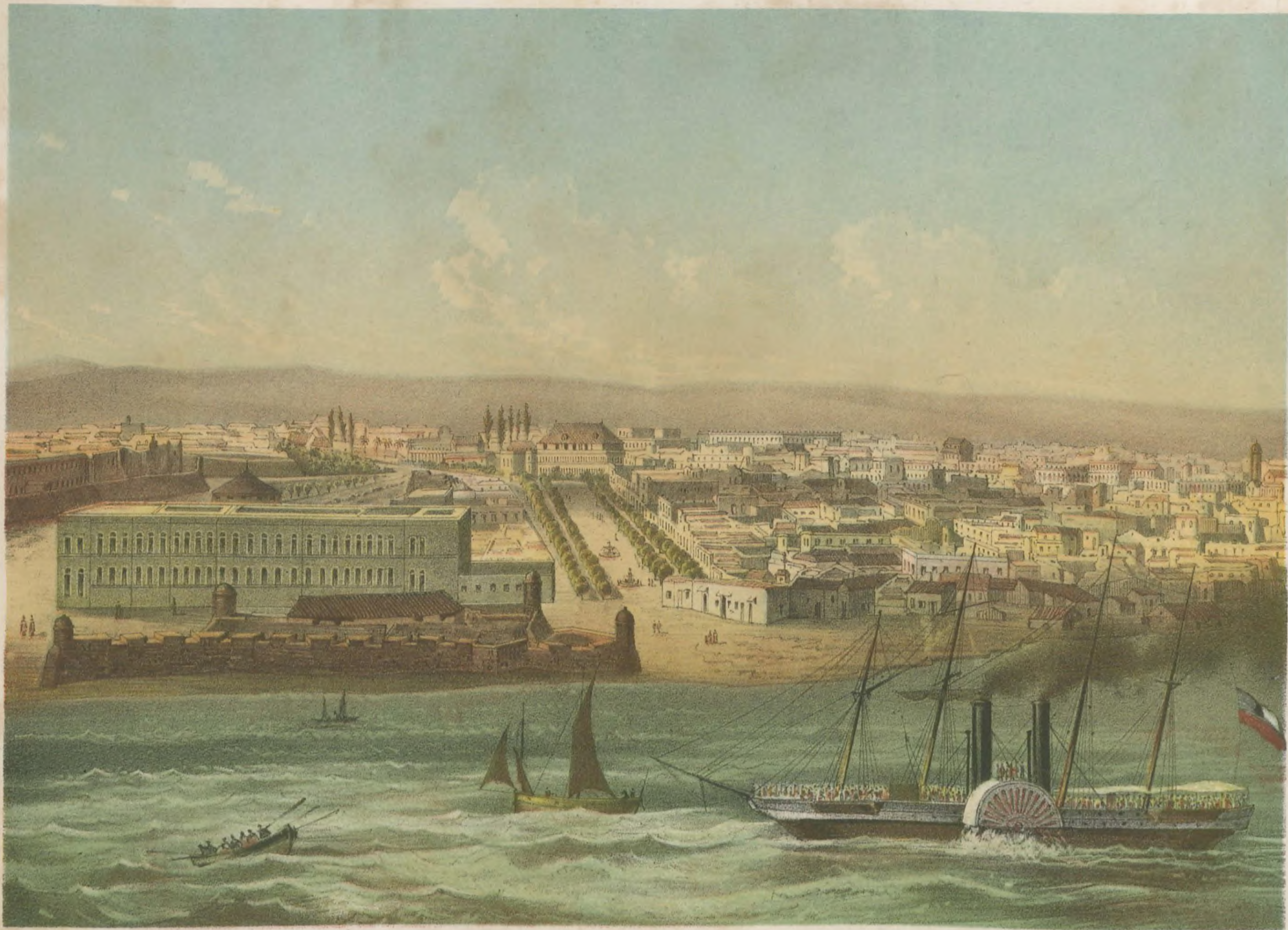
VISTA DE LA HABANA, PARTE DE ESTRAMUROS Tomada desde la entrada del Puerto