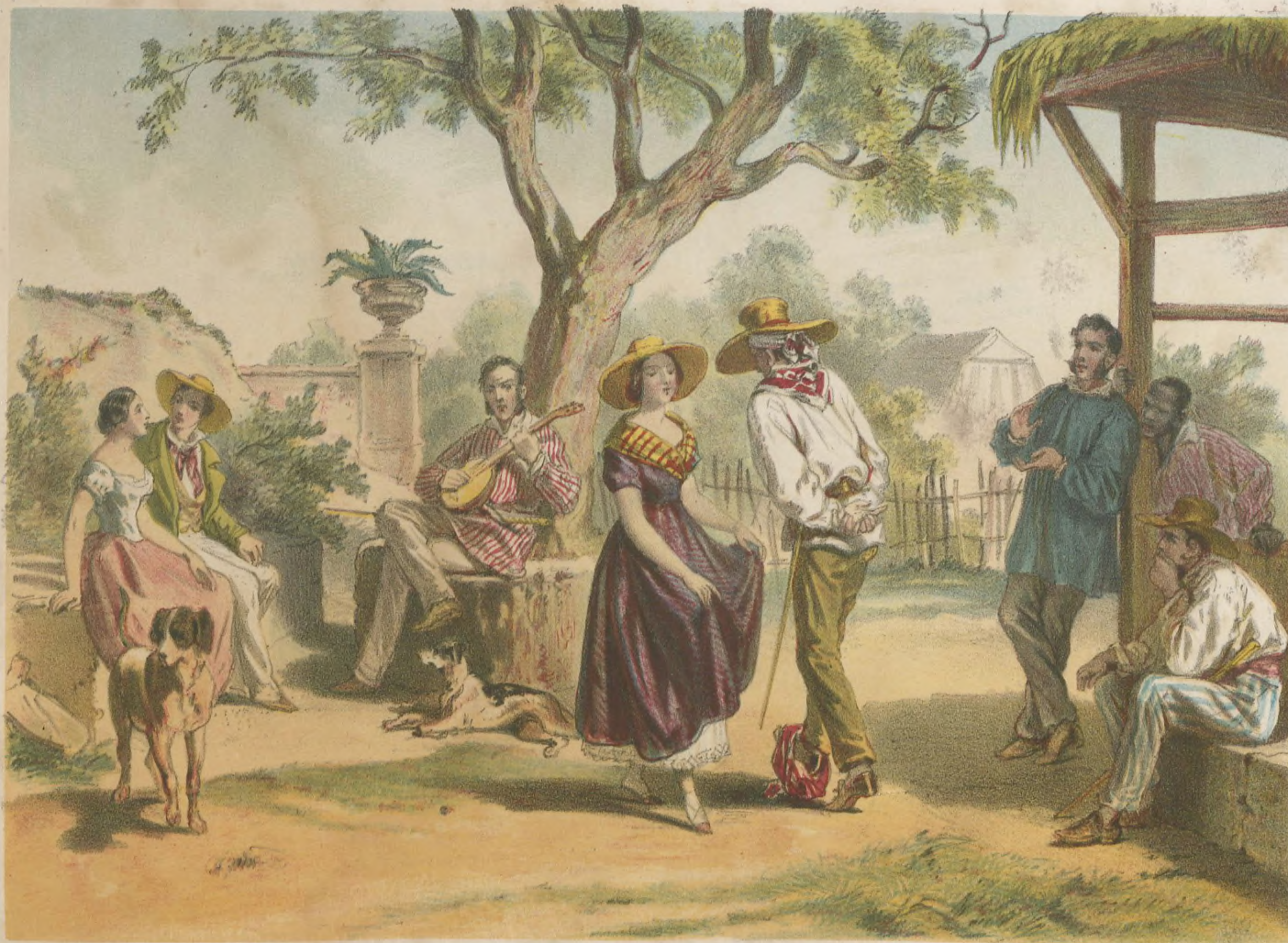
EL ZAPATEADO. The Zapateado (national dance)