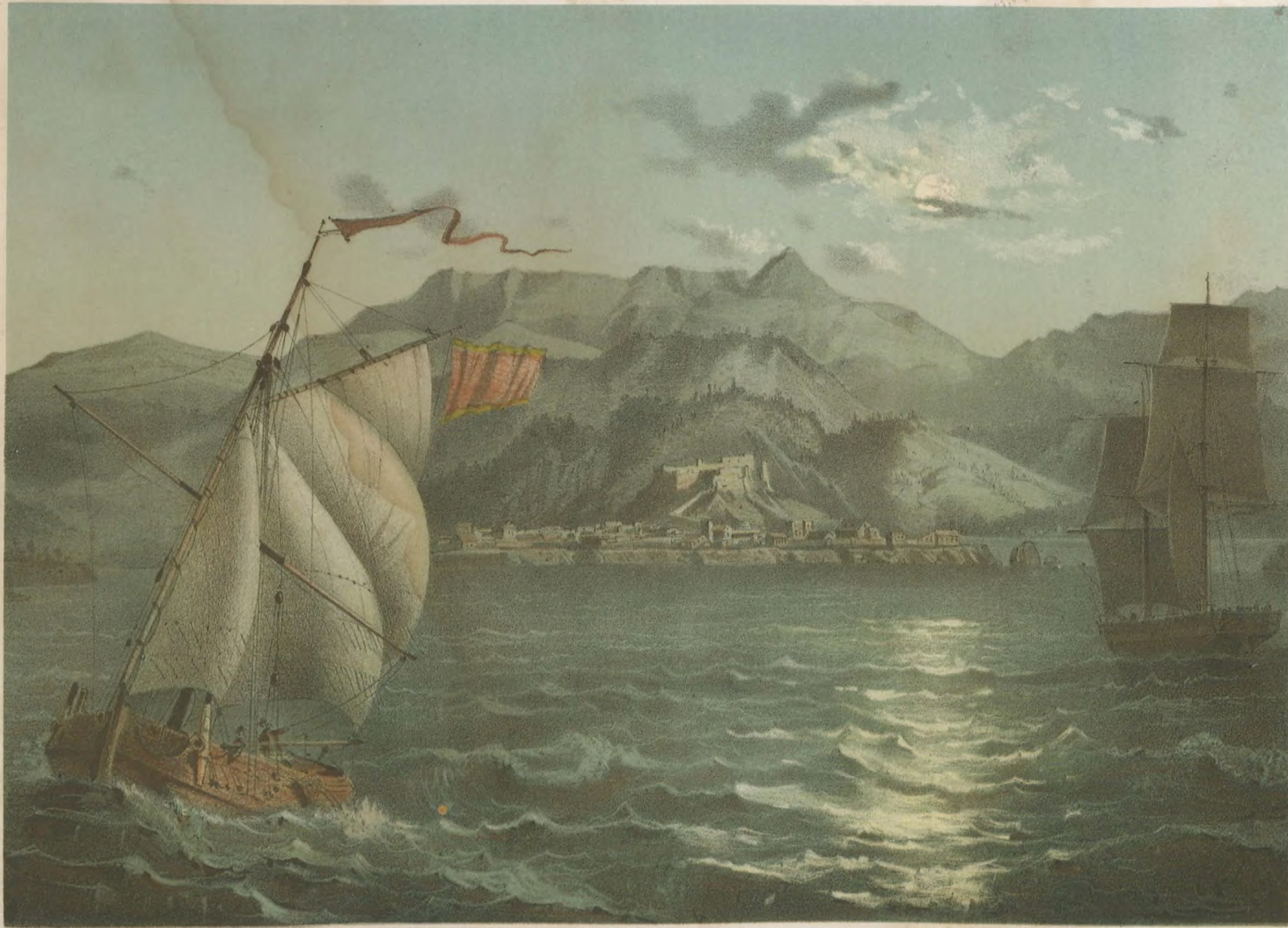
VISTA GENL. DE LA CIUDAD Y MONTAÑAS DE BARACOA. (Costa del Norte.)