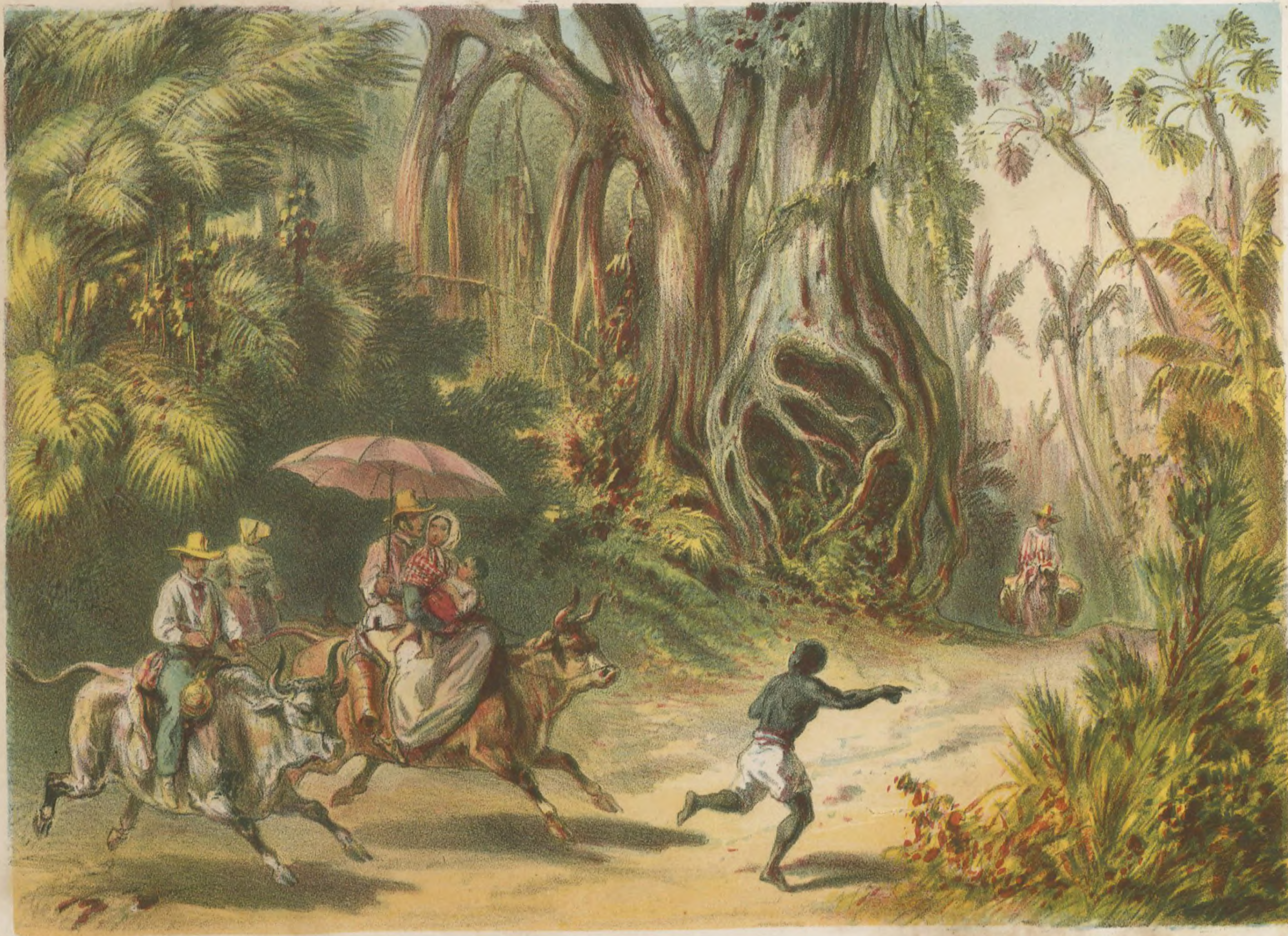
CERCANIAS DE BARACOA y modo de viajar de sus naturales.