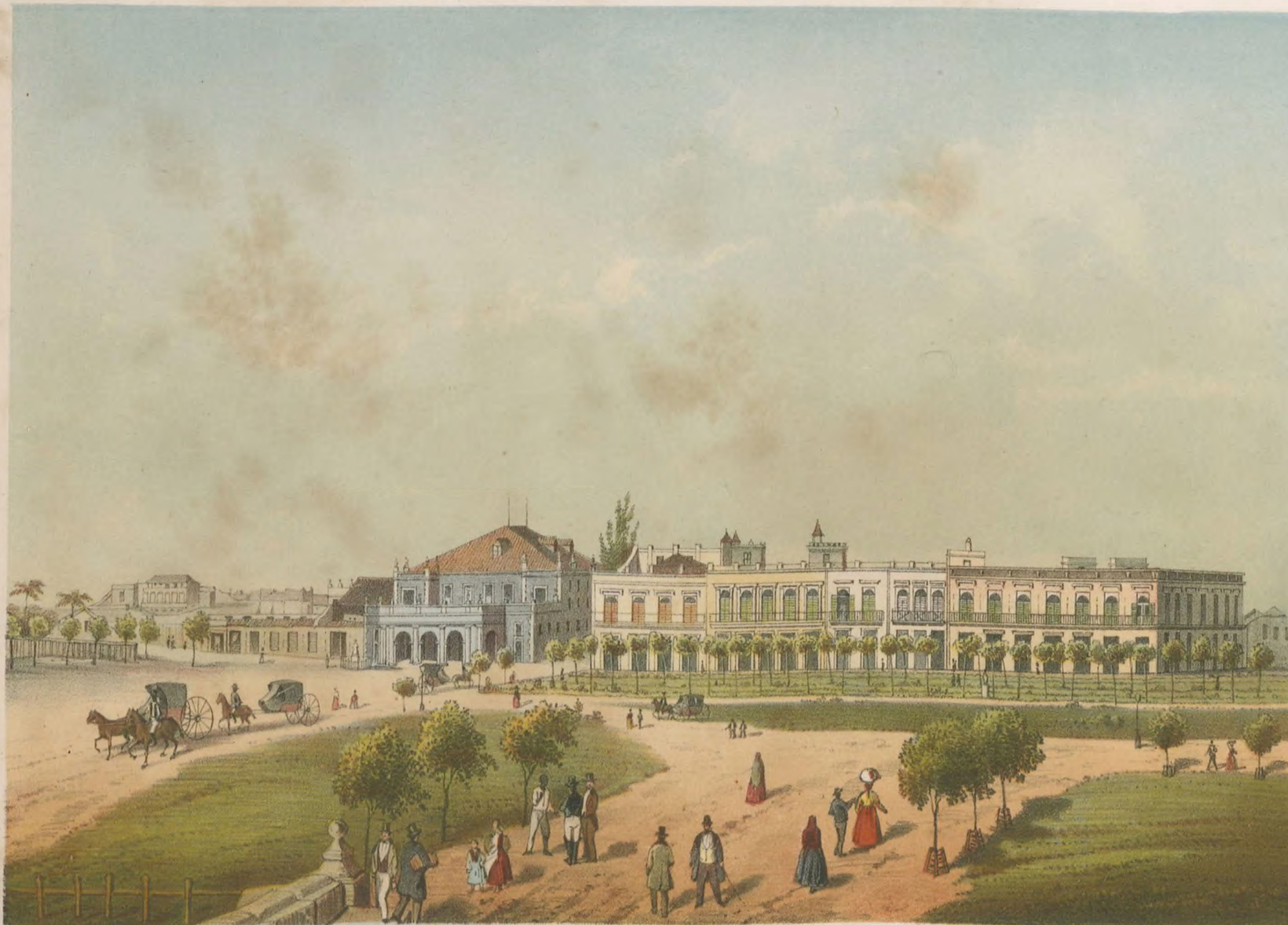
TEATRO DE TACÓN Y PARTE DEL PASEO DE ISABEL II. Vista tomada desde la puerta del Monserrate