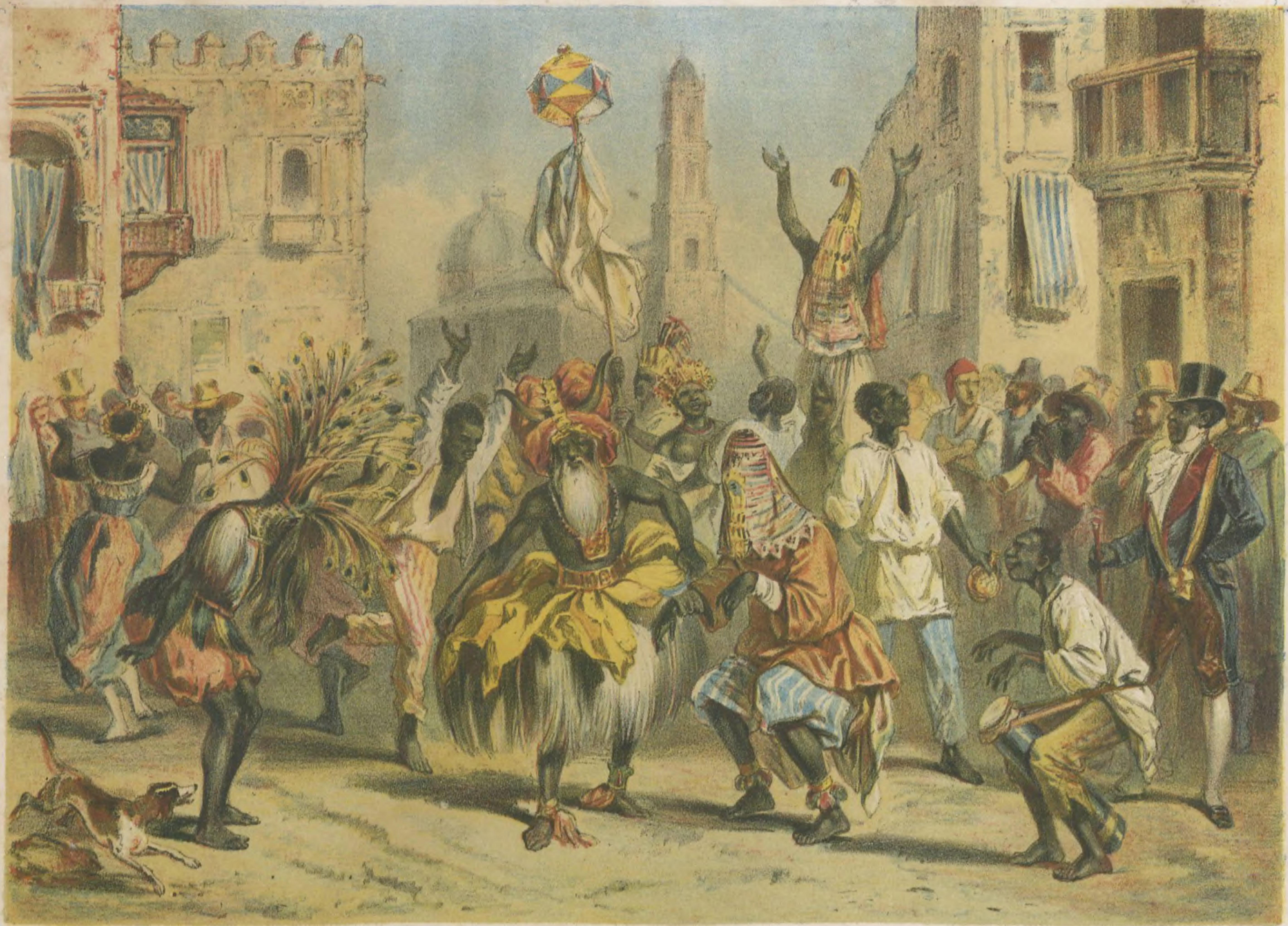
DIA DE REYES. The Holy Kings' day.