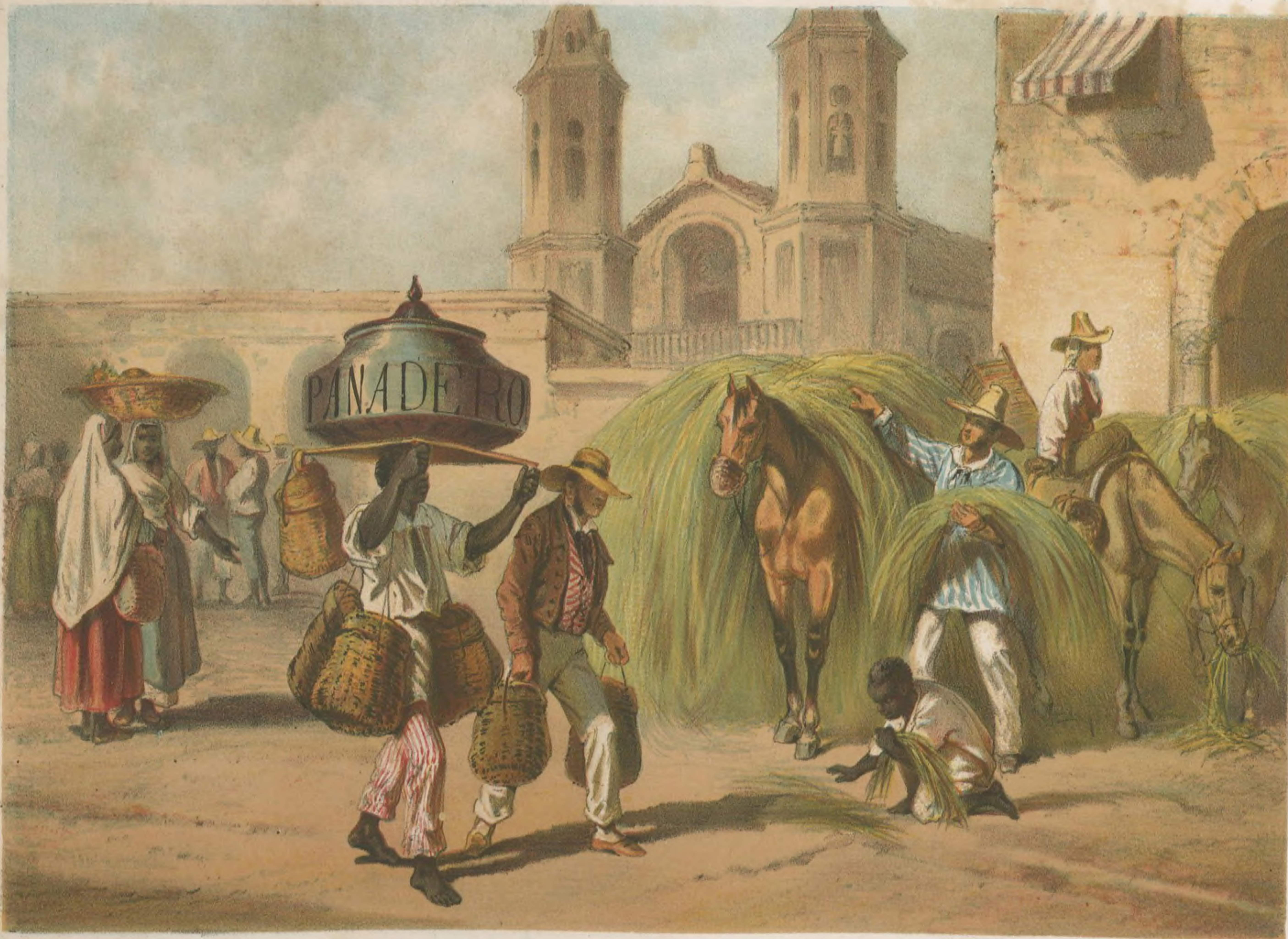
EL PANADERO Y EL MALOJERO.