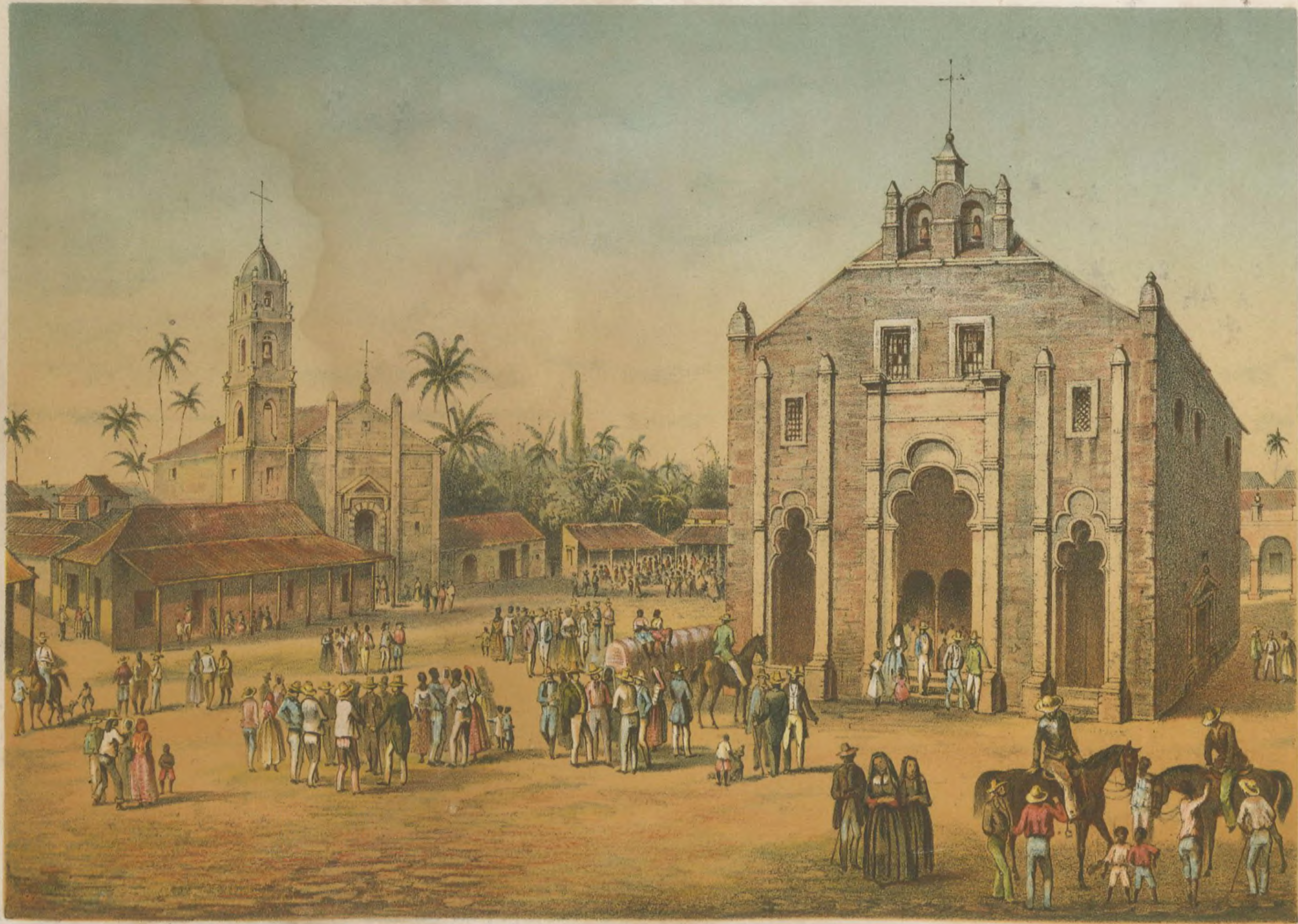
VISTA DE LA IGLESIA MAYOR Y DE LA ERMITA DEL BUEN VIAJE en San Juan de los Remedios.