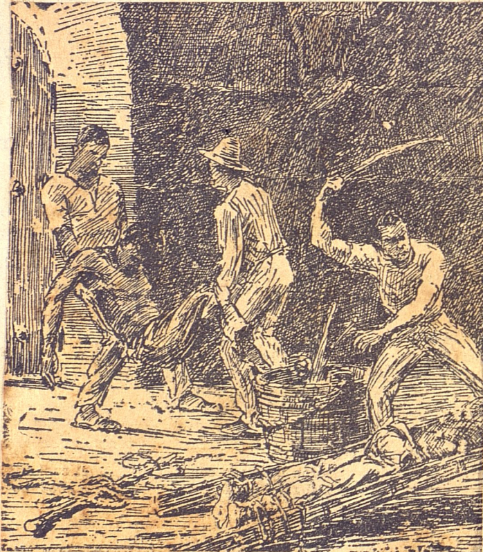
Un apunte de Hernández Giménez

El programa de la escuela cubana en Cuba libre es el de educar a la juventud en el espíritu de independencia y de libertad, en el anhelo de una patria libre y soberana, en el deseo de una vida mejor para todos los cubanos.