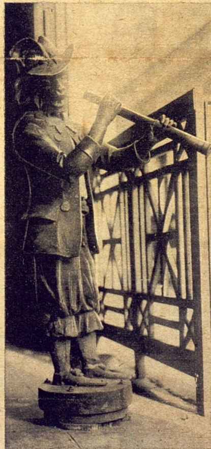
Este es el portero del Potro Andaluz. Lleva sesenta años desempeñando el oficio en esta casa de la calle Teniente Rey y le quedan fuerzas para seguir desempeñándolo otros 60 años más