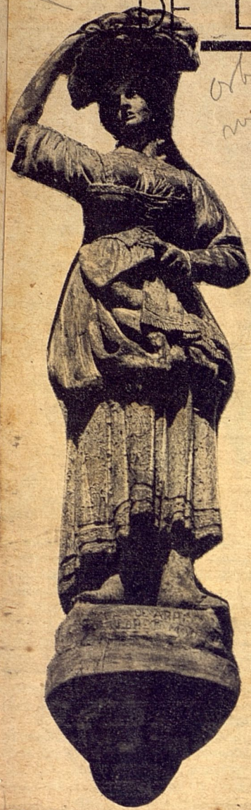
"Vendedora de Frutas de la Casa de las Figuras"