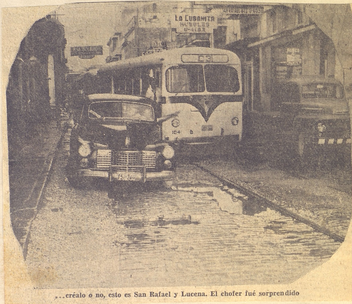
... créalo o no, esto es San Rafael y Lucena. El chofer fué sorprendido