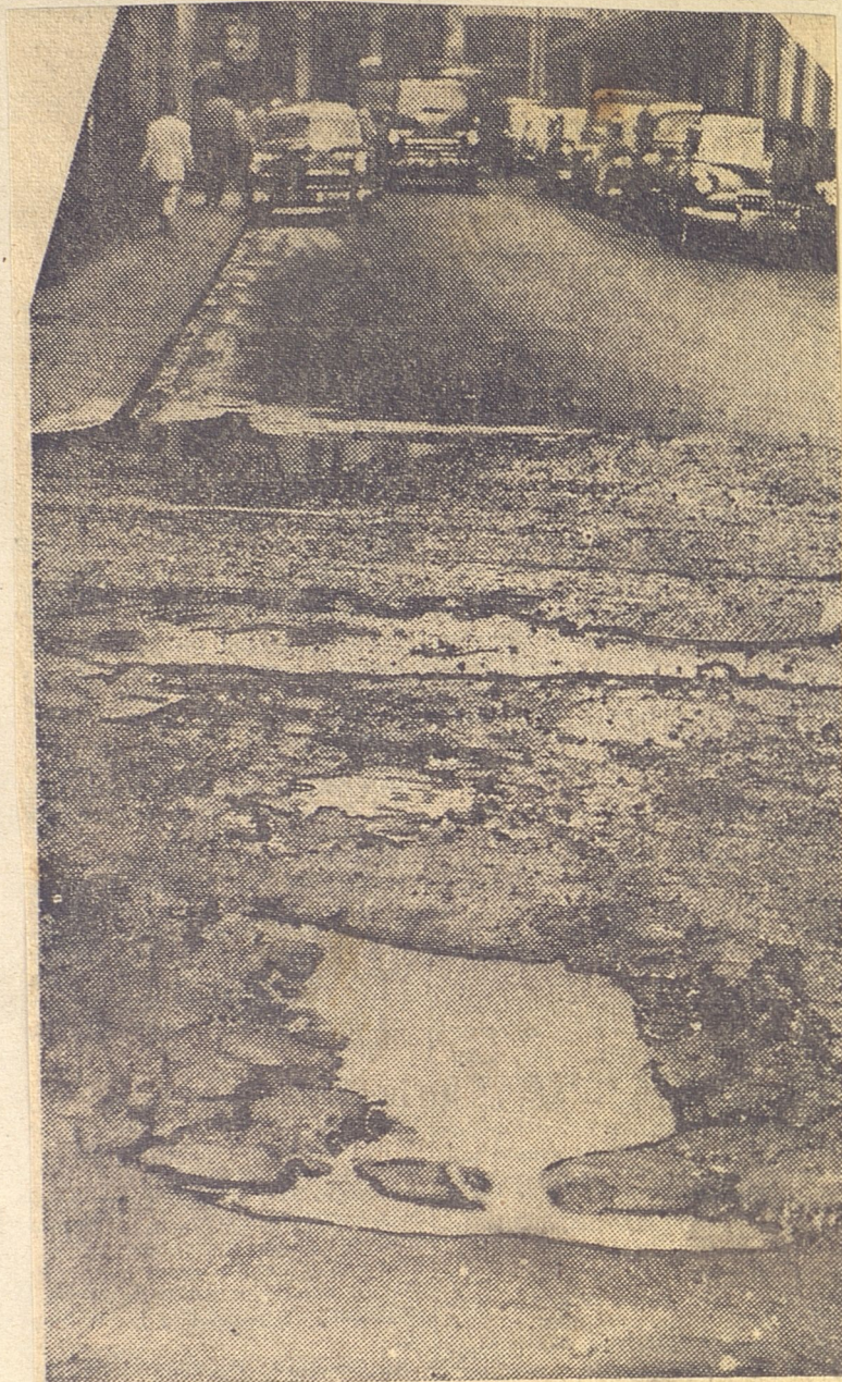
...lo más céntrico de la capital. Sí, en Aguila frente a Barcelona