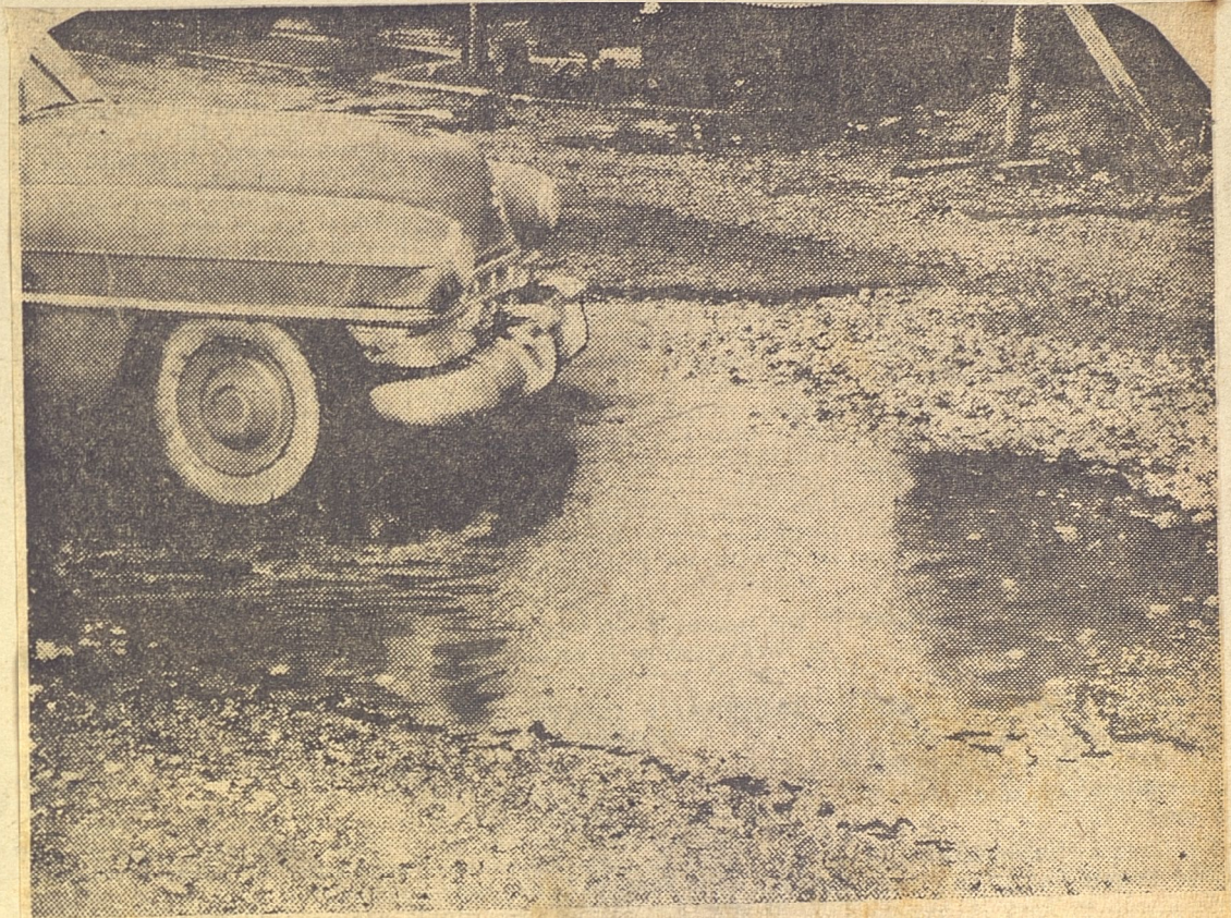
... Calle 4 y 7a. Avenida, que conduce al puente sobre Almendares, hacia La Habana.