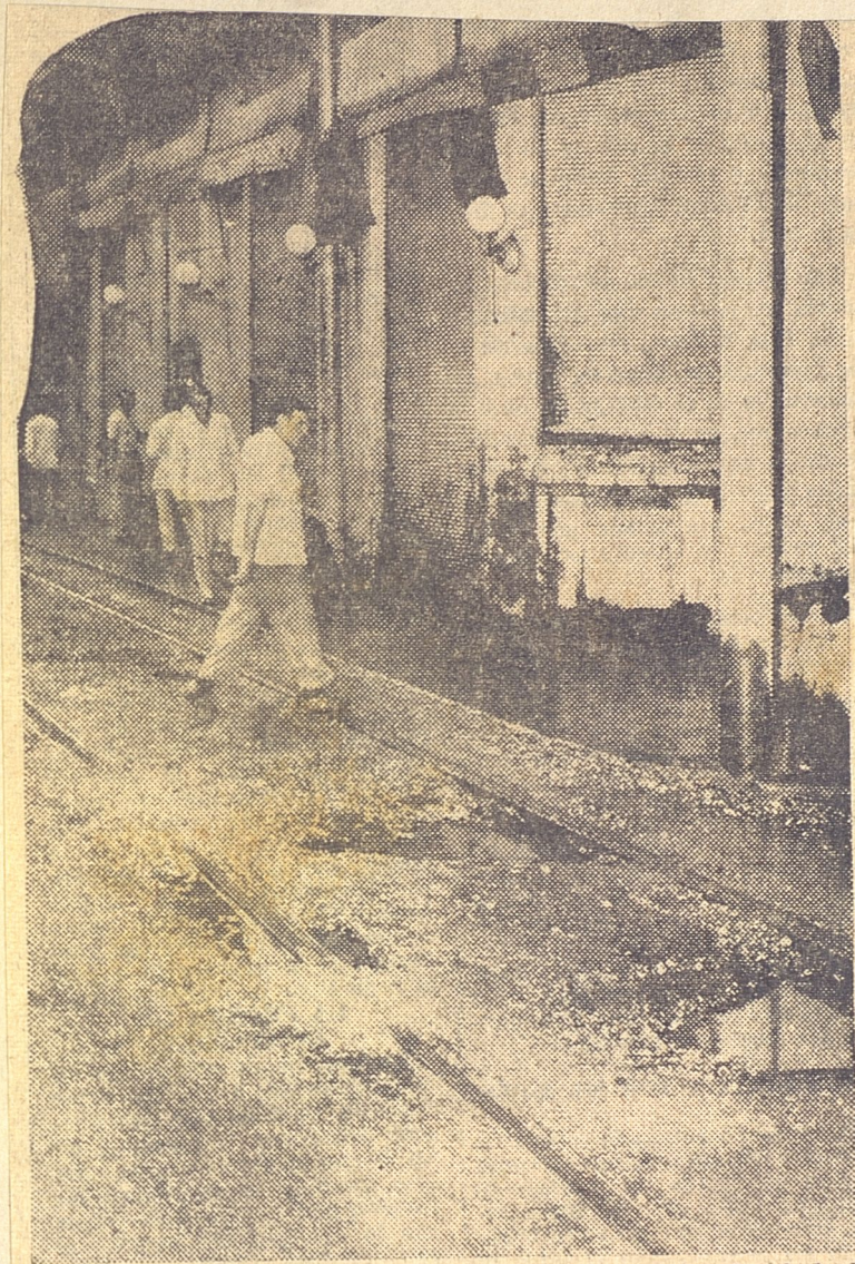
... es el "Miami", en Prado y Neptuno. Ayer cerró a las 4 de la tarde. El fango se colaba con más facilidad que los clientes.