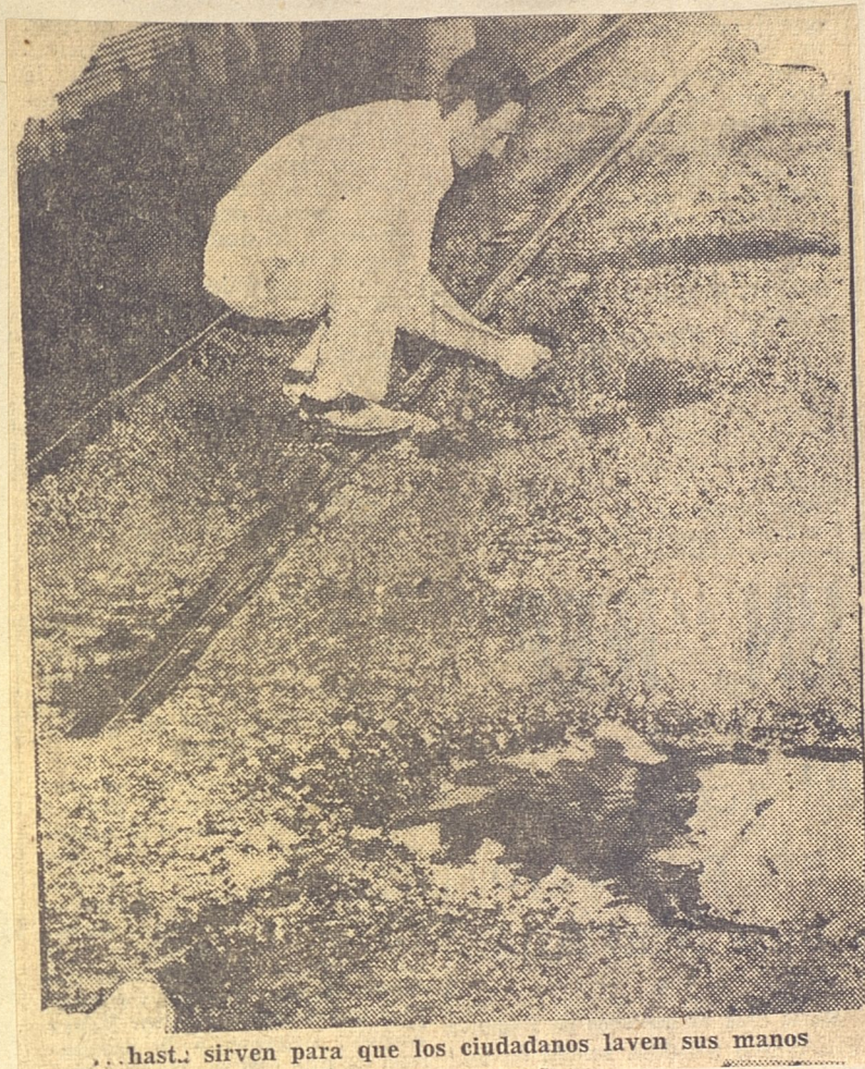
...hasta sirven para que los ciudadanos laven sus manos