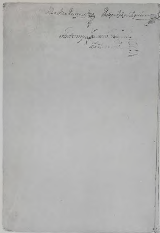
Segunda página del acta de juramento de obediencia y fidelidad de la Ciudad de la Habana al rey de la Gran Bretaña.