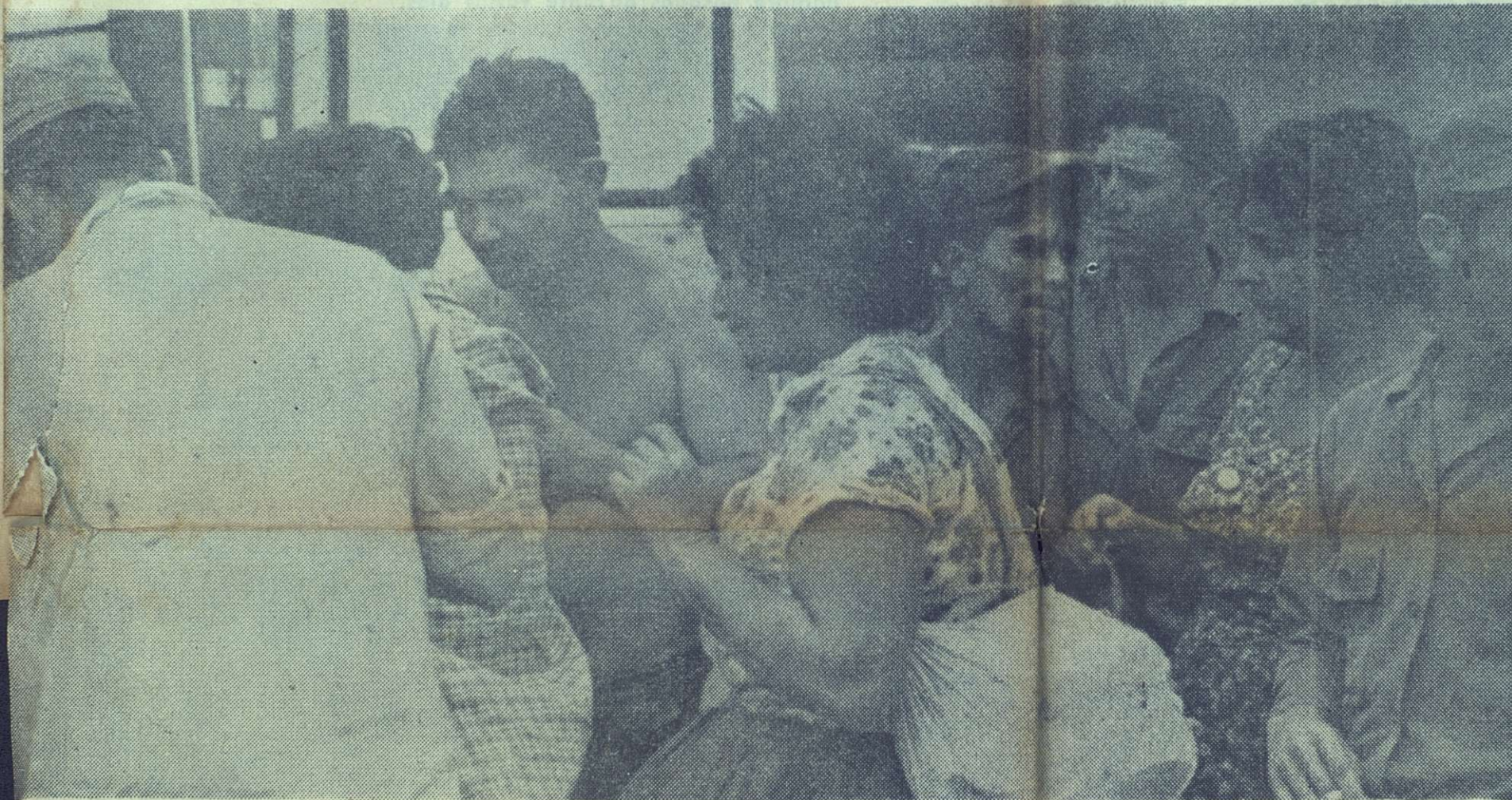
Instante en que una familia rescatada en helicóptero era trasladada a una ambulancia en el aeropuerto de Bayamo. Véase a esta campesina cómo sólo pudo rescatar de sus pertenencias un pequeño jolongo.

DIARIO DE la tarde ⑤ La Habana, 11 de Octubre de 1963