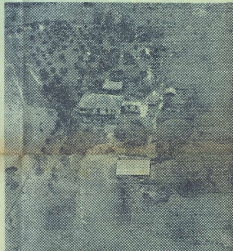
Vista aérea de una zona agraria de Oriente, donde puede apreciarse los campos de siembra cubiertos por las aguas. Todo cuanto allí había sembrado se perdió.

DIARIO DE la tarde ⑤ La Habana, 11 de Octubre de 1963