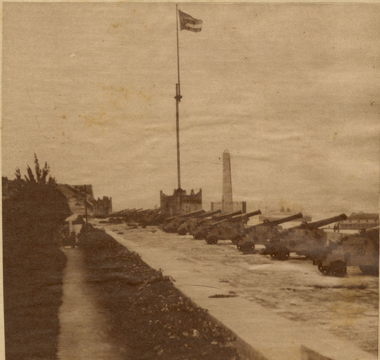
Una hilera de cañones, viejos, grises, montados a la grupa de bancos esqueléticos de madera, como si fueran dientes malos y gigantes de la boca de un río...