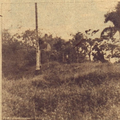
Allá en el fondo de la foto, en San Lorenzo, un modesto busto recuerda al Padre de la Patria, donde recibió el balazo mortal.

Han transcurrido ochenta y un años de los memorables sucesos, esclarecidos por Gerardo Castellanos, antes que por ningún otro historiador, en su libro "En busca de San Lorenzo", donde demostró de manera irrefutable cómo había muerto el hombre de La Demajagua, el