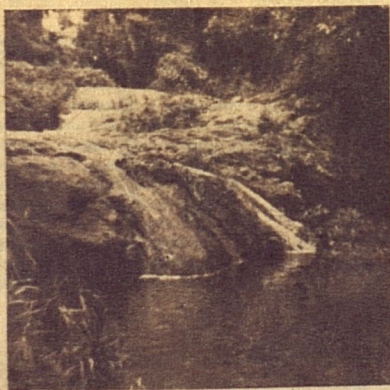
El "Baño de Céspedes", en Arroyo Manacal, San Lorenzo, tal como está hoy.

edificio de la Intendencia, que le era contiguo, toda la mañana del 1º de marzo y la tarde de ese día hasta las cuatro y media, cuando en un carretón fueron llevados los restos del Padre de la Patria al cementerio de Santa Ifigenia, para enterrarlos en una fosa común.